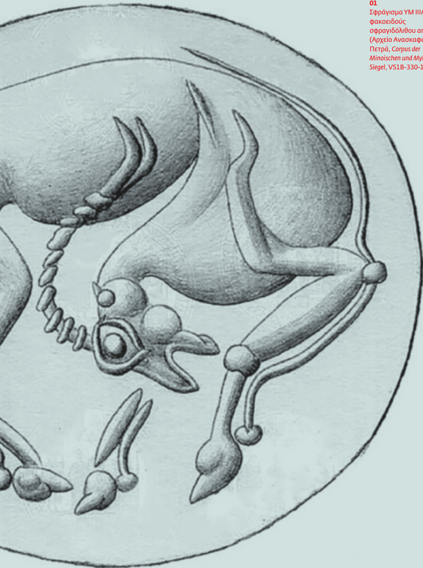
01 Σφράγισμα ΥΜ ΙΙΙΑ1 φακοειδούς σφραγιδόλιθου από ίαση (Αρχείο Ανασκαφών Πετρά, Corpus der Minoischen und Mykenischen Siegel , VS1B-330-1).