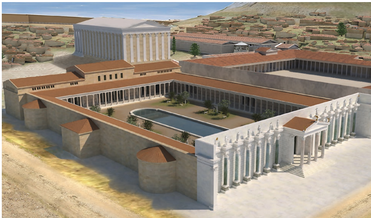
Φωτορεαλιστική απεικόνιση της Βιβλιοθήκης του Αδριανού από τα βορειοδυτικά (αναπαράσταση: Δ. Τσαλκάνης, Χ. Κανελλόπουλος, Λ. Τσατσαρώνη).

Το ρωμαϊκό Περιστύλιο, νότια του περιβόλου του