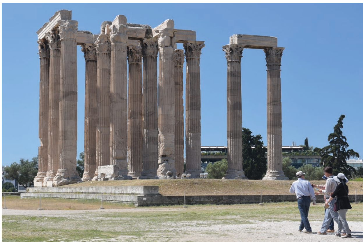
Ο ναός του Ολυμπίου Διός από βορειοανατολικά (Το Ολυμπεϊόν υπάγεται στην αρμοδιότητα της ΕΦΑ Πόλης Αθηνών.).

Ολυμπεϊού, έχει κάτοψη με τετράγωνη αυλή (65,40x45,26 μ.), είσοδο στα ανατολικά και δύο ορθογώνιες εξέδρες στις μακρές πλευρές (10x6 μ.). Στην υπαίθρια αυλή εντοπίστηκαν τα θεμέλια ναού (11,40x15,50 μ.) κορινθιακού ρυθμού που ανάγεται στην εποχή του Αδριανού και, σύμφωνα με τον Τραυλό, ταυτίζονται με τον ναό της Ήρας και του Δία Πανελληνίου και το ιερό του Πανελληνίου.