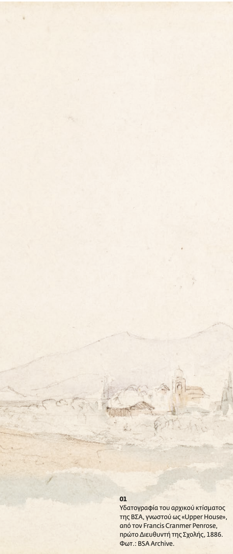
01 Υδατογραφία του αρχικού κτίσματος της ΒΣΑ, γνωστό ως «Upper House», από τον Francis Cranmer Penrose, πρώτο Διευθυντή της Σχολής, 1886.