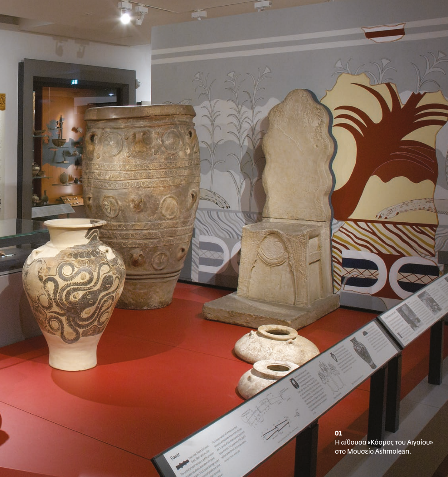
01 Η αίθουσα «Κόσμος του Αιγαίου» στο Μουσείο Ashmolean.