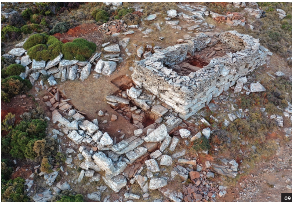
08-11 Το Δρακόσπιτο στη θέση Ίλκιζες Στύρων.