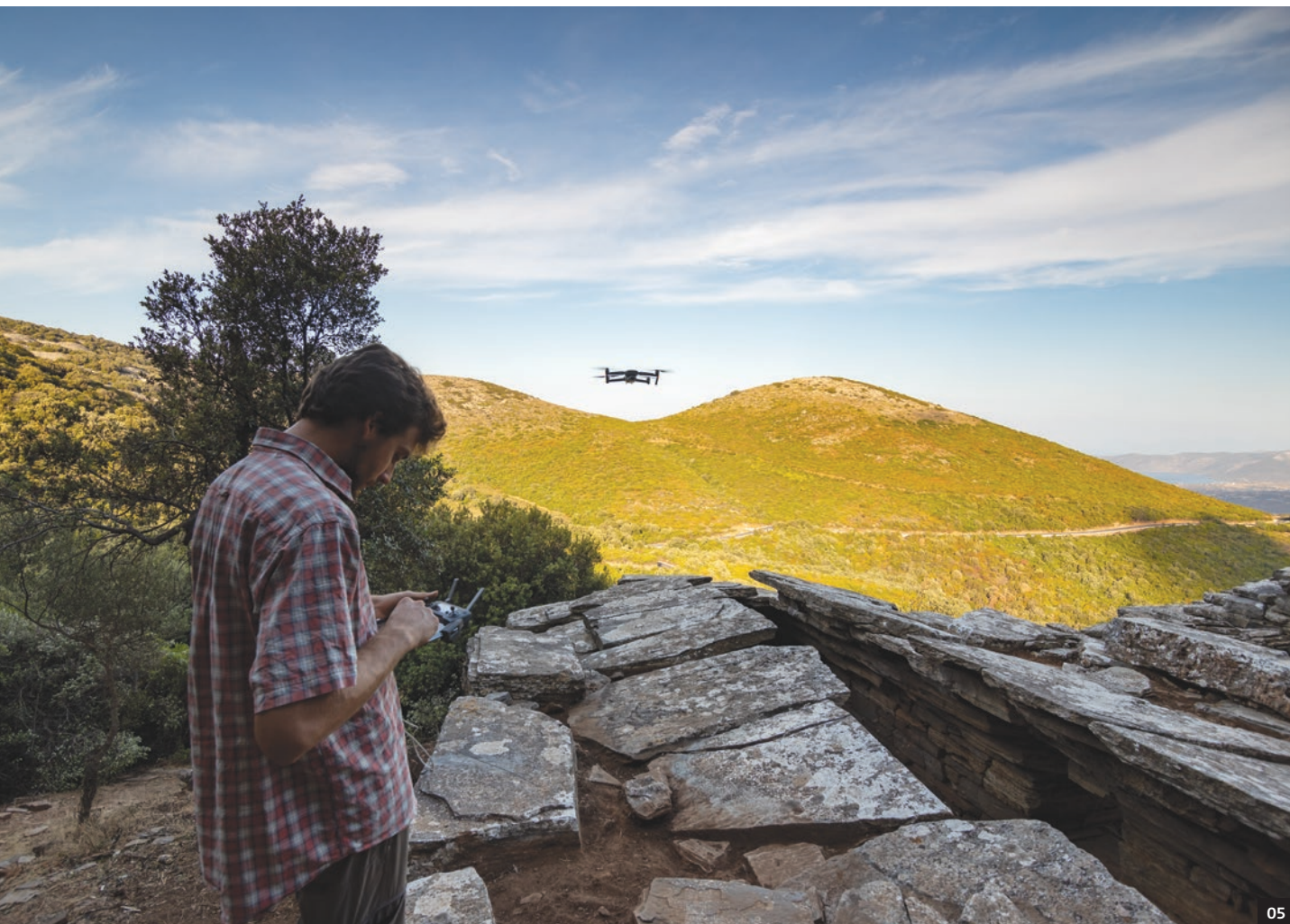
04-07 Τα Δρακόσιπτα στη θέση Πάλλη Λάκκα Στύρων.