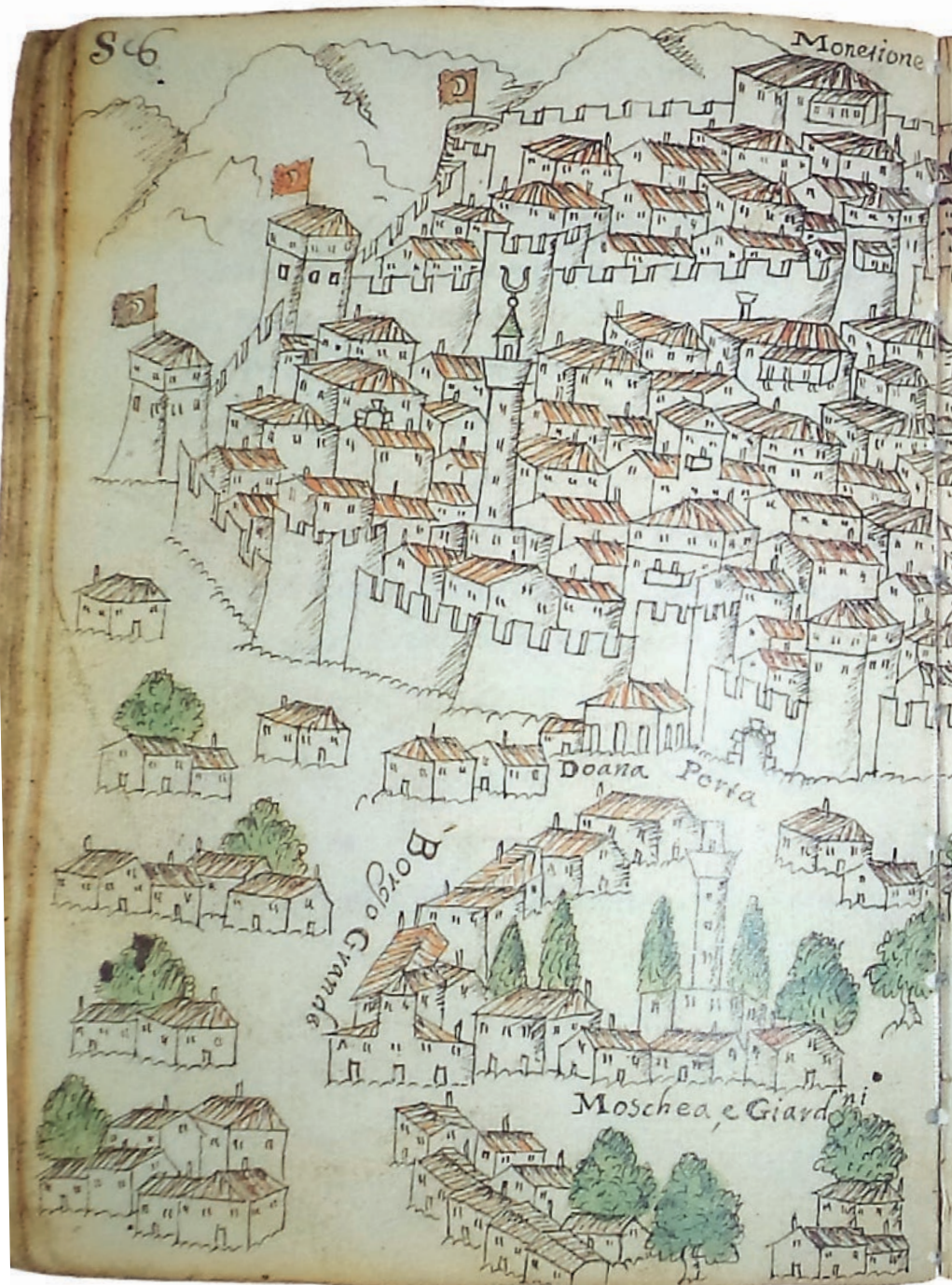
01 «Η Καλαμάτα ευάλωτη». Laura Marasso / Anastasia Stouraiti: Immagini dal mito: la conquista veneziana della Morea, 1684–1699 , Venezia 2001.