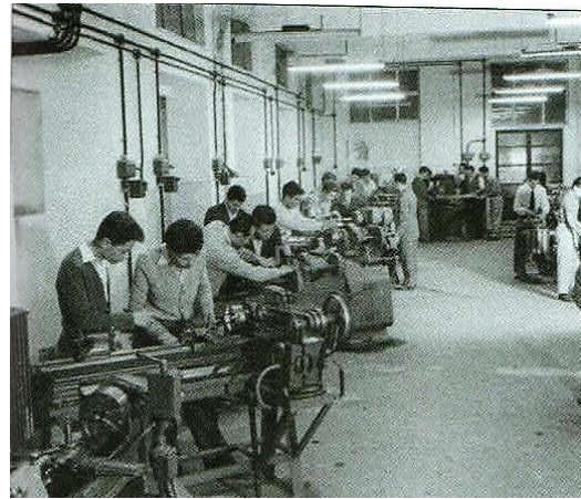
Φωτογραφίες από τη λειτουργία της Διπλαρείου Σχολής, Ζ. Ρωπαΐτου, Ο κόσμος της Ευριπίδου και των πέριξ , Αθήνα 2018