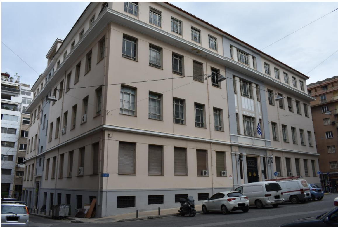
Εξωτερική άποψη της Διπλωρείου Σχολής, 2020. Αρχείο MONUMENTA

Ομοιότητες παρουσιάζει και με άλλα σημαντικά εκπαιδευτικά κτήρια της εποχής, την Ανωτάτη Εμπορική Σχολή (1926-30) στην οδό Πατησίων, έργο του γνωστού αρχιτέκτονα Αναστάση Μεταξά, το Αρσάκειο Ψυχικού (1933) του αρχιτέκτονα Ανδρέα Κριεζή, το Κολλέγιο Αθηνών (1929) του αρχιτέκτονα Γ. Σούλη, τη Σιβιτανίδειο Σχολή (1927), τη Λεόντειο Σχολή Πατησίων (1924), τη Σεβαστοπούλειος Τεχνική Σχολή, και την Αναργύρειο και Κοργιαλένιο Σχολή Ύδρας (1927) του αρχιτέκτονα Π. Ζίζηλα. Όλα, αποτελούν ουσιαστικά τον πρόδρομο της αρχιτεκτονικής του προγράμματος της εκπαιδευτικής μεταρρύθμισης του 1930, που πραγματοποιήθηκε από την Τεχνική Υπηρεσία του Υπ. Παιδείας, από τους πρώτους απόφοιτους της Αρχιτεκτονικής Σχολής του ΕΜΠ, στις αρχές του μοντέρνου κινήματος.