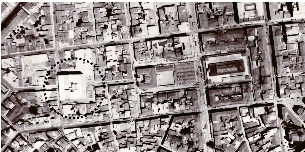
Η Διπλάρειος Σχολή σε αεροφωτογραφία του 1937, σε αξονική διάταξη με το Βαρβάκειο Λύκειο και τη Δημοτική Αγορά Αθηνών.