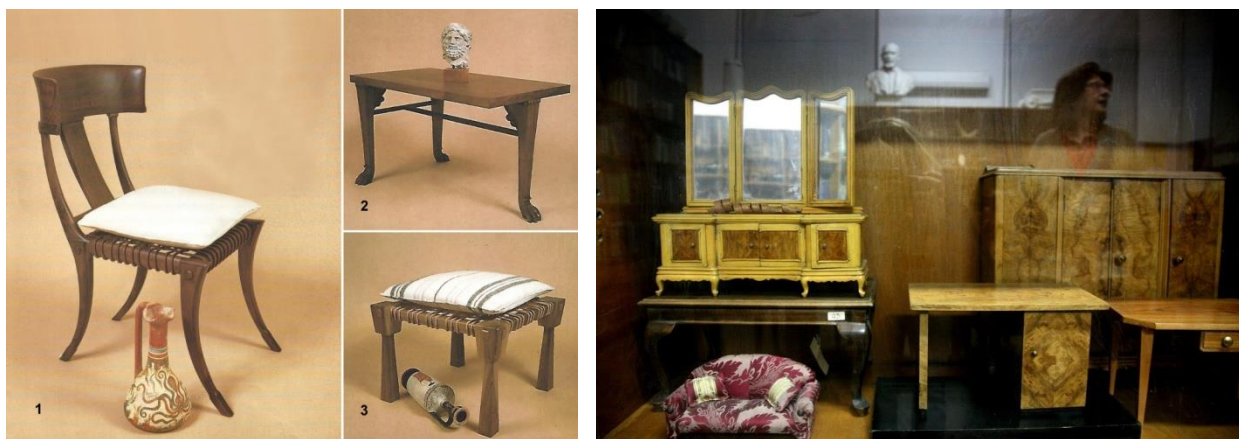
Έργα μαθητών Διπλαρείου Σχολής, https://ewood.gr/

Αξιόλογοι καθηγητές δίδαξαν στη Σχολή, όπως οι αρχιτέκτονες Κων. Δοξιάδης, Δημ. Πικιώνης, Κλ. Κραντωνέλλης, Αριστ. Προβελέγγιος, οι εικαστικοί Κ. Μαλάμος, Αγ. Αστεριάδης, κ.ά., ενώ σημαντικοί για την οικονομία της χώρας υπήρξαν απόφοιτοι, όπως ο ιδρυτής της εταιρείας Βαράγκη.