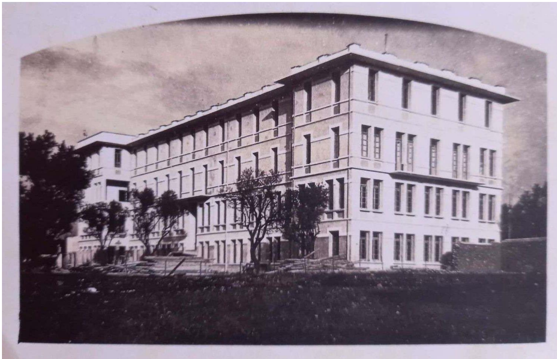
Εικ. 2, Λεόντειος Σχολή