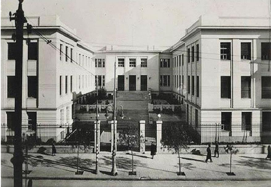
Εικ. 1, Ανωτάτη Εμπορική Σχολή Αθηνών