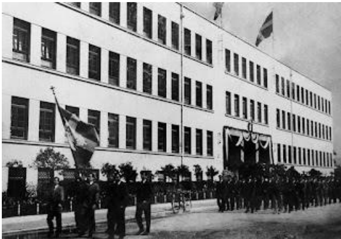
Εικ.6, Σιβιτανίδειος Σχολή