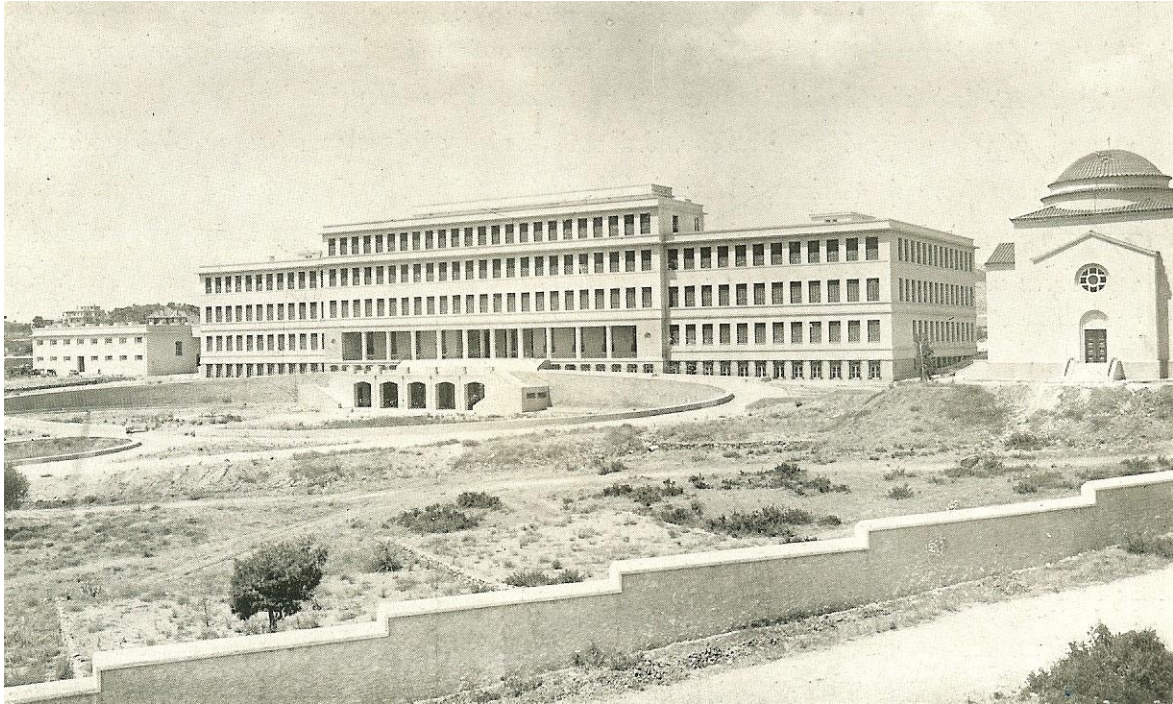
Εικ.3, Αρσάκειο Σχολείο (Ψυχικό)