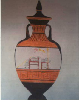
2. Αμφώρας, ζωγραφική με μολύβι και έλκομογιές της μαθητριάς της Α. Λυκείου Αλεξάνδρας Γκούζου.