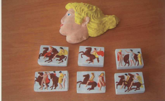
1. Ίριδα, κομμάτια της ζωφόρου από γύψο και χρωματισμένα από τους μαθητές της Α' τάξης του του Ενιαίου Λυκείου Κολαράτας.

• Δημιουργία κινήτρων για την ανάπτυξη της δημιουργικότητας και της εφευρετικότητας μαθητών και εκπαιδευτικών.