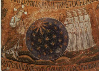
3. Η Δημιουργία του Κόσμου (κατά τη Γένεση), (κάτω). Λεπτομέρεια (δεξιά): ο Κύριος δημιουργεί τα ουράνια σώματα, ψηφιδωτό, 13ος αι. Βενετία, Άγιος Μάρκος (αίθριο, τρούλλο).

Καθένα εντάσσεται και υποτάσσεται στον κύκλο της ζωής και του θανάτου, που καθορίζεται από το θείο στοιχείο. Ο άνθρωπος δεν δικαιούται να διαταράξει τον κύκλο της ζωής, γι' αυτό απαγορεύεται ο φόνος (-ου φονεύσεις-) τόσο του άλλου ανθρώπου όσο και του ίδιου του εαυτού μας.