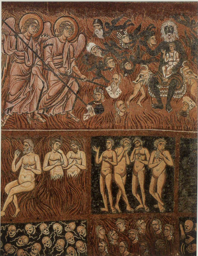
4. Οι αμρτιαλοι υποβαλλόμενοι σε μαρτύριο στην Κάλοση, παράσταση σε τρεις ζώνες. Από το ψηφιδωτό της Δευτέρας Παρουσίας, αρχές 12ου αι. Βενετία, Τορτσέλο, Santa Maria Assunta (ναός).