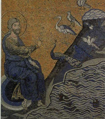
2. Η Δημιουργία του Κόσμου: (αριστερά) ο Χριστός δημιουργεί τον έναστρο ουρανό, τον ήλιο, τη σελήνη και το στερέωμα. Η Δημιουργία των φοριών και πτηνών (δεξιά). Τμήματα ψηφιδωτού της Γένεσης 1180-1190. Σκελίδα, Μονραάλε, Μητρόπολη (ναός).

Η θεμελιώδης αντίληψη που υπόκειται σε μια τέτοια κατηγορηματική άρνηση της αυτοκτονίας βρίσκεται στην εξίσωση της αυτοχειρίας με τον φόνο. Δολοφονία και αυτοκτονία εκλαμβάνονται ως ισοδύναμα συμβάντα. Κοινός παρονομαστής των δύο αυτών γεγονότων είναι η αφαίρεση της ανθρώπινης ζωής. Διαφορετικός αριθμητής αυτοκτονίας-δολοφονίας είναι μόνον το εκάστοτε θύμα αυτής της θανατηφόρας πρωτοβουλίας. Στην αυτοκτονία υπάρχει ταυτοπροσωπία δράστη και θύματος, ενώ στη δολοφονία σημειώνεται ετεροπροσωπία θύτη και θύματος. Στην πρώτη περίπτωση ο άνθρωπος σκοτώνει τον εαυτό του, ενώ στην άλλη περίπτωση κάποιος θανατώνει πάντοτε κάποιον άλλο.