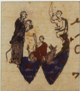
5. Πρωτογράμματα Μ, Π, Τ, Τ, Ρ και Ω από τις Λειτουργικές Ομιλίες του Αγίου Γρηγορίου Ναζιανζηνού, περ. 1062. Τορίνο, Biblioteca Nazionale Universitaria.