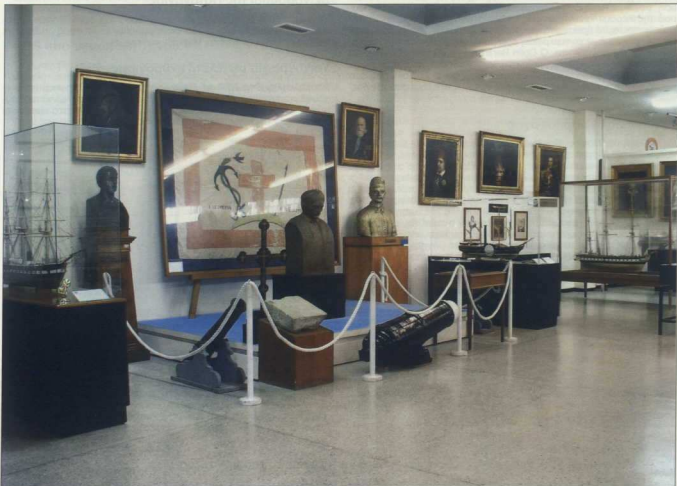
5. Η αίθουσα Ε.

Τέλος, στο Ναυτικό Μουσείο της Ελλάδος λειτουργεί το πωλητήριο που φιλοδοξεί να αποτελέσει όχι μόνο πωλη- τήριο αναμνηστικών από την επίσκεψη στο Μουσείο, αλλά ένα χώρο που μας προσφέρει ποιοτικά δώρα που μας προ- καλούν να ανακαλύψουμε την ιστορία τους και να ξαναγυ- ρίσουμε για έρευνα στους χώρους του Μουσείου, καθώς και επιστημονικά βιβλία που θα εξυπηρετήσουν τους μαθη- τές, φοιτητές και ερευνητές που ασχολούνται και ενδιαφέ- ρονται για την ναυτική μας κληρονομιά και παράδοση.