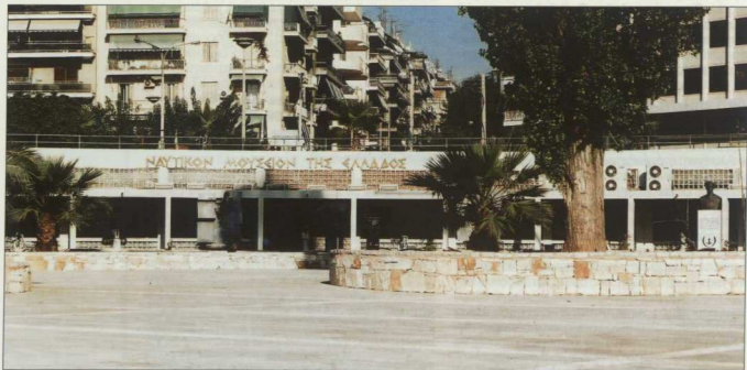
1. Η πρόσοψη του Ναυτικού Μουσείου της Ελλάδος.

Η περιήγησή μας αρχίζει από την αίθουσα Γ, στην οποία έχει περιληφθεί τμήμα από το αρχαίο τείχος, που σώζεται τμηματικά σε όλο το μήκος της Πειραικής. Το τείχος αυτό κατασκευάστηκε μετά το 394 π.Χ. από το στρατηγό Κόνωνα. Οι κίονες των νεώσοικων του πολεμικού ναυστάθμιου των αρχαίων Ελλήνων στη Ζέα, όπου φυλάσσονταν το χειμώνα οι Τριήρεις, καθώς και αρχαίες πέτρινες άγκυρες, αμφορείς και άλλα αντικείμενα στον ίδιο χώρο, καταδεικνύουν την έντονη ναυτική δραστηριότητα και τη στρατηγική σημασία της περιοχής γύρω από το Μουσείο κατά την αρχαιότητα. Εδώ ξεκί-