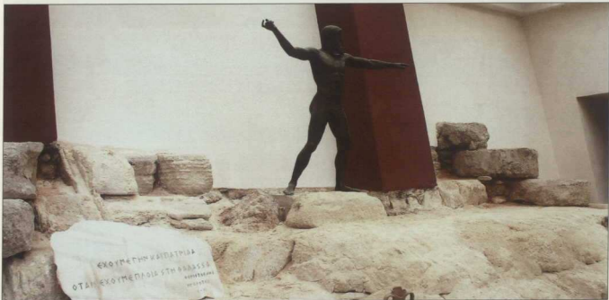
3. Η αίθουσα Γ' και εισόδος του μουσείου.

Και σαλπάρουμε στην αίθουσα Ε', όπου συναντάμε σπουδαία ιστορικά κειμήλια, όπως σημαίες, προσωπικά αντικείμενα των αγωνιστών και όπλα της εποχής, ομοιώματα ιστορικών πλοίων και πίνακες σημαντικών ζωγράφων, όπως του Κ. Βολανάκη και Α. Κριεζή, που ζωντανεύουν μπροστά στα μάτια μας τον Αγώνα της Ανεξαρτησίας του 1821 και φωτίζουν σημαντικά γεγονότα της Επανάστασης.