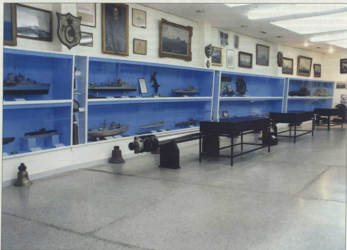
4. Η αίθουσα Ζ.

Σημαντικά είναι ακόμη τα αρχεία του Ναυτικού Μουσείου της Ελλάδος. Το αρχείο χαρτών αποτελείται από 500 περίπου σπάνιους χάρτες του 16ου, 17ου και 18ου αιώνα διάσημων χαρτογράφων της εποχής που μας παρουσιάζουν την ιστορία και την εξέλιξη της χαρτογραφίας του ελλαδικού χώρου.