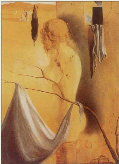
3. Σαββαντόρ Ησαΐ, «Το σημείο της σημασίας», 1936.

Οι ανωτέρω αυτόχειρες στωικοί διανοητές δεν νόμιζαν τον εαυτό τους σοφό, παρατηρεί ο Rist. Τότε γιατί αυτοκτόνησαν; Ο Rist για την επίλυση του προβλήματος δεν επιστρατεύει τους Κινικούς, για τους οποίους ο καβένας, αν το ήθελε, θα μπορούσε να αυτοκτονήσει. Δεν επικαλείται ούτε τη διανοητική τους ανισορροπία. Πρώτα, ωστόσο, ας μνημονευθεί το ιστορικό της