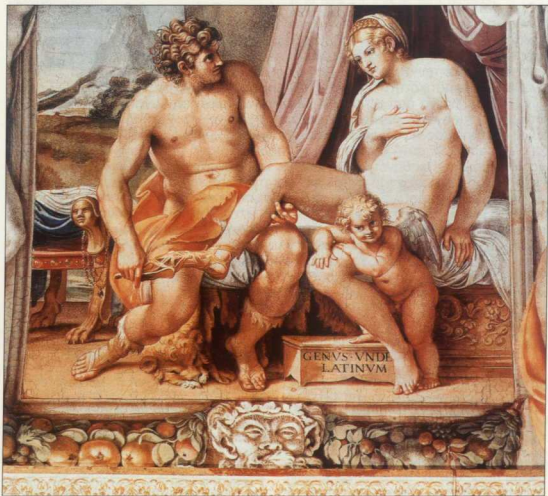
2. Ανιωματε Καράτσι, «Αφροδίτη και Αγκίσιος», Palazzo Farnese, Rome