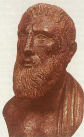
1. Ζήνων ο Κιπείος, φιλόσοφος, ο θεμελιωτής της στωικής φιλοσοφίας. Χάλκινη προτομή του 2ου αι. μ.Χ. (Νεάπολη, Εθνικό Μουσείο).