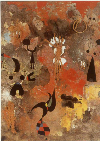
5. Σπύρος Μίρο, «Ζυγροφικά», 1950. Ελαιόχρωμα και σκόνι σε μουσαμά. Εντύχθεν, Δημοτικό Μουσείο του Αθηνών.

Για ποιους, λοιπόν, λόγους αυτοκτονεί ο σοφός; Ο θάνατος κατατασσόταν από τους Στωικούς μεταξύ των «αδιαφόρων». Το γεγονός αυτό,