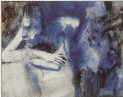
6. Πάρμηλο Πικόσο, «Μελαγχολική νεανίσκα», 1904-5.

ελευθερίας εντάσσεται και η άποψη ότι ο σοφός ζει όσο πρέπει όχι όσο μπορεί 28 . Ο Επικτήτος (2ος αι. μ.Χ.) διδάσκει ότι η θύρα της εξόδου από τη ζωή είναι πάντοτε ανοικτή, ενώ ο άνθρωπος, όπως το παιδί που σταματά το παιχνίδι όταν δεν του αρέσει, μπορεί να εισέλθει στη θύρα αυτή, όταν τα πράγματα της ζωής, κατά την άποψή του, φθάσουν στο επίπεδο της πλήρους απərəσκείας 29 . Ο άνθρωπος δεν είναι αιώνιος, αλλά μέρος του σύμπαντος, όπως η ώρα είναι μέρος της ημέρας. Έτσι, έρχεται στον κόσμο σαν την ώρα και φύγει σαν αυτήν. Ως εκ τούτου, ο φρύγας Στωικός δεν βλέπει καμία διαφορά αν φύγει με πνιγμό ή με πυρετό 30 . Ο στωικός τύπος του σοφού είχε και μίαν άλλη αρετή. Ήξερε να κάνει το καθετί στον καιρό του. Πράγματι, η αυτοκτονία θα μπορούσε να ήταν, σε μια στιγμή, η λογικότερη επιλογή 31 . Η διαφύλαξη της ζωής, σύμφωνη προς την ανθρώπινη φύση, επειδή δεν είναι πάντοτε αρμόζουσα προς αυτήν 32 , ενίοτε περιφρονείται μετ' εμφάσεως από τον σοφό.