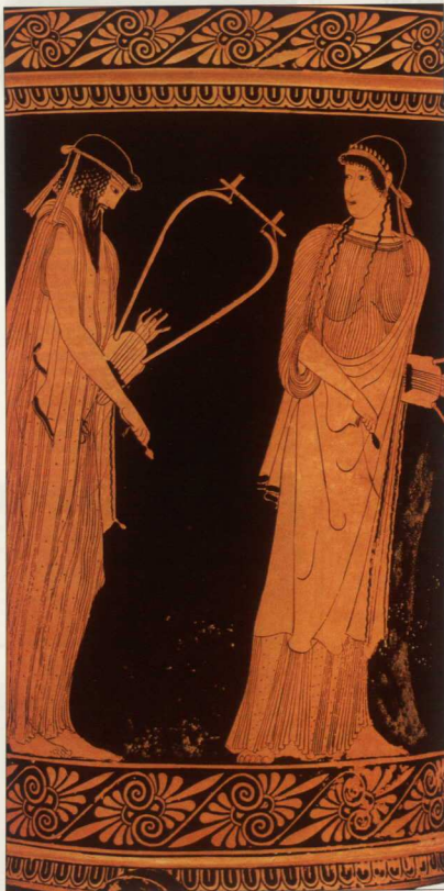
1. Η Σαπφώ και ο Αλκαίος, κρατώντας λύρα στο αριστερό χέρι και πλέκτρο στο δεξί. Αρχαιολογικό Μουσείο, Μόναχο, 480 π.Χ.

Σ τους κλασικούς χρόνους και ιδιαίτερα στην τραγική ποίηση του 5ου αιώνα π.Χ., το φαινόμενο της αυτοχειρίας χρησιμοποιήθηκε πολύ συχνά στις τραγωδίες, όπου η μοίρα των ηρώων τους ήταν άρρηκτα συνδεδεμένη με τη γνώση του Απόλυτου που επέβαλαν οι θεοί, δηλαδή την «αιώνια τάξη» ανθρώπων και πραγμάτων. Αν ο άνθρωπος λειτουργούσε ως περιφρονητής αυτής της τάξης, έσπρωχνε τον εαυτό του και τον κοινωνικό του περίγυρο στην εκμηδένιση, ανατρέποντας τη λεγόμενη καθεστηκυία τάξη. Το γεγονός αυτό, που στοιχειοθετούσε την «ύβριση», τον οδηγούσε πολλές φορές στην αυτοχειρία, ως μόνο μέσο επιβολής της «κάθαρσης». Διότι το άτομο αποτελεί μέλος μιας κλειστής ο-