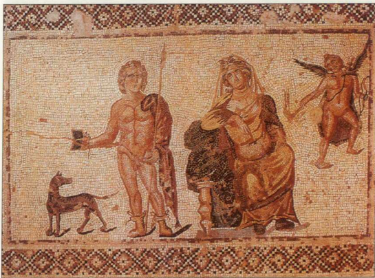
3. Η Φαίρα, ο Ιππόλυτος και ο Έρως, Ψηφιδωτό από την «Οικία του Διονύσου», Νέα Πύργος, αρχές 3ου αι. μ.Χ.

Η πολυβρύλητη τελευταία βασίλισσα της Αιγύπτου γεννήθηκε το 69 π.Χ. Πατέρας της ήταν ο Πτολεμαίος ΙΑ', Νέος Διόνυσος (ο Αυλητής). Δεν είναι γνωστό, όμως, αν η μητέρα της υπήρξε νόμιμη σύζυγος του Πτολεμαίου, την οποία παντρεύτηκε μετά το θάνατο της πρώτης συζύγου του Κλεοπάτρας Τρύφανας, η κάποια παλακή