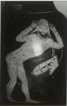
4. Ερυθρόμορφη οinoχόη (περίπου 460-435 π.Χ.), Hamburg, Museum für Kunst und Gewerbe. α) ένας Έλληνας (αριστερά) επιτίθει, αναγγέλλοντας «Είμαι ο Ευρυμέδων [ενν. ποταμός]», β) ο θηλυκρεπής Πέρσης (δεξιά) σκύβει πρόσωπα, αποντώντας «Είμαι παθητικός». Αλληγορία της νίκης των Ελλήνων επί των Περσών παρά τον Ευρυμέδοντα ποταμό, περίπου 460 π.Χ.