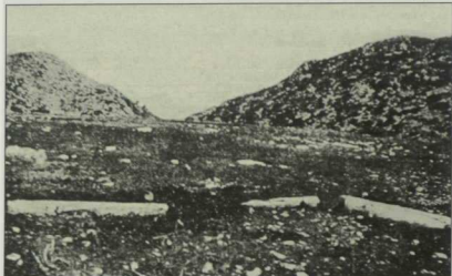
8. Πλάκες άφρασης.