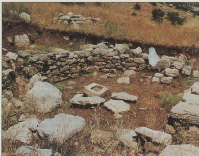
8. Ξενίας (φωτογραφία του συγγραφέα, 2002).

Σύμφωνα με ωδή του Πινδάρου ( Νεμ. 10), στα αρχαία Λύκαια οι νικητές έπαίρναν ως έπαθλο ένα χάλκινο σκεύος 37 : «Σκευινόνθε δ' ἄργυρωθέντες σὺν οἰνηραῖς φιλαίας ἄπεβαν, ἐκ δὲ Πελλάνας ἐπιεσάμενοι νῶτον μαλακαῖσι κρό-