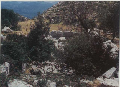
9. Λουτρό.

Ὅπως προαναφέρθηκε, οι αγώνες είχαν αρχικά και για αρκετούς αιώνες τοπικό χαρακτήρα παναρκαδικής εμβέλειας. Εξαιτίας της αλλαγής τους όμως προσέλκυσαν και αθλητές άλλων πόλεων, όπως ο διπλός ολυμπιονίκης του σταδίου και του πεντάθλου Ξενοφών από την Κορίνθο (Πίνδαρος, Ολ 13), ο πυγμαχός Διαγόρας (Ολ 7), ο παλαιστής Θέαιος από το Άργος ( Νεμ. 10), ο παλαιστής Εφάρμοστος από την Οπούντα (Ολ 9) και άλλοι που αναφέρονται στον κατάλογο των Λυκαιοκίων.