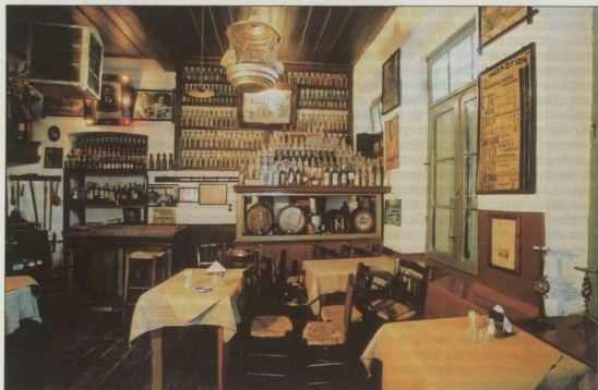
4. Λάρισσα, Οινόπνευμαλείον Νίκ. Νικόδημου, εσωτερικό (φωτ. Α. Παυλίδη, 7.7.2005).

αλλά έναν αυθεντικό χώρο παλιού μαγαζιού, που επιβίωσε παρ' έλπιδα από τη λαίλαπα της αντιπαροχής με όλα του τα αντικείμενα και εξαρτήματα και διατηρεί τη λάμψη και τη ζεστασιά, που μόνο η ζωή που φιλοξενεί μέσα του μπορεί, χάρη στη συνεχιζόμενη χρήση του, να εξασφαλίσει.