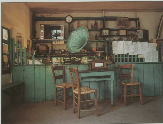
7. Αμόρανα, Κίρκια, Καφενέιον Κίμων Σαββίδη, 3 Νοεμβρίου 1999.