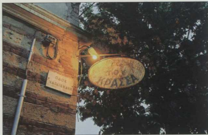
2. Λεπτομέρεια του εξωτερικού του οινοπρωτογενείου.