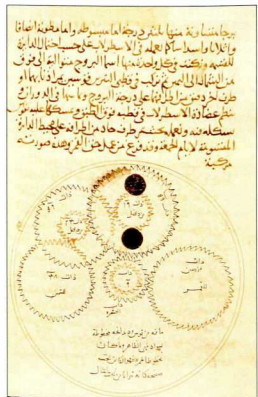
5. Το «Κουτί της Σελήνης» του αλ-Μπιρουνι: χειρόγραφο, που απεικονίζει ένα σχέδιο οδοντωτού μηχανισμού το οποίο περιγράφεται στο κείμενο. Ο αντιγραφές έκανε κάποια λάθη στο σχέδιο του, αλλά το κείμενο καθιστά τη ρύθμιση σαφή.

Ο ίδιος ο δίσκος έχει την αντίστοιχη κεντρική οπή για τη συναρμολόγηση του οργάνου και φέρει δύο αναμενόμενα είδη κλίμακας που αντιστοιχούν στις δύο προσαρμογές που πρέπει να γίνουν όταν χρησιμοποιείται το ηλιακό ρολόι: μια κλίμακα του τεταρτοκυκλίου για το γεωγραφικό πλάτος κοντά στην άκρη του δίσκου και μια κλίμακα διπλού φάσματος για την απόκλιση του Ήλιου (σημειώνεται με συντομογραφίες των μηνών του χρόνου σύμφωνα με το ιουλιανό ημερολόγιο). Υπάρχει επίσης ένας πίνακας με τοπωνύμια και τις συνταγμένες τους (που είναι χρήσιμος για τη ρύθμιση του δίσκου στο σωστό γεωγραφικό πλάτος). Το στοιχείο αυτό συνήθως βρισκόταν στην οπίσθια όψη του δίσκου, αλλά σε αυτήν την περίπτωση η πίσω πλευρά του δίσκου πρέπει να βρισκόταν στο εσωτερικό του κουτιού, και, όπως θα δει-