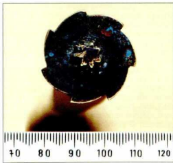
2. Το Βυζαντινό Ηλιακό Ρολόι Ημερολόγιο: ο δίσκος της Σελήνης με τις ημέρες του μήνα χαραγμένες σε ελληνική γραφή. Αρχικά, ο δίσκος είχε σταβωθεί με γύψο και οι απές είχαν πιθανώς διατηρήσει ίχνη κάποιας ακουαχρωμικής ουσίας.