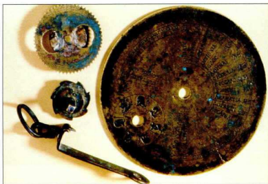
1. Το Βυζαντινό Ηλιακό Ρολόι Ημερολόγιο, Μουσείο Επιστημών, Λονδίνο, αρ. ευρ. 1983-1393. Τα τέσσερα τμήματα που σώζονται: ο κύριος δίσκος με σημάδια ηλιακού ρολογιού, ο βραχιόνιος ανάρτησης και ο δακτυλίσκος, και δύο κινητά τμήματα.

Ο κατάλογος με τα τοπωνύμια πόλεων και περιφερειών, διασκοπισμένων σε μεγάλο μέρος της Βυζαντινής Αυτοκρατορίας εκείνης της