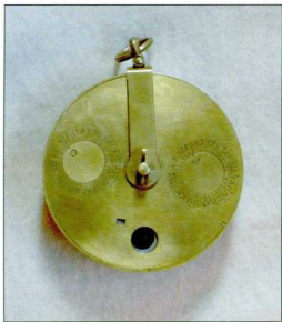
6. Αναπαράσταση του Βυζαντινού Ηλιακού Ρολογιού Ημερολογίου από τον Μ.Τ. Wright, πρόσθια όψη: διακρίνονται οι κλίμακες του γνόμωνα, οι κλίμακες της απόκλισης αστρικών και τοπωνυμίων με γεωγραφικές συντεταγμένες του ηλιακού ρολογιού, καθώς και ο δείκτης που δείχνει την ημέρα της εβδομάδας, με τον οποίο λειτουργεί το ημερολόγιο.