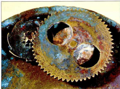
4. Το Βυζαντινό Ηλιακό Ρολόι/Ημερολόγιο: τα δύο κινητά τμήματα, συναρμολογημένα στην πίσω όψη του κυρίως δίσκου, δείχνουν πώς το μικρό γρανάζι με τα επτά δόντια, που στρεφόταν μία φορά την εβδομάδα, κινεί τον δίσκο της Σελήνης με τα 59 δόντια.

νης της σημασίας του ως επιστημονικού τέχνηρου, και παρά την ταπεινή του καταγωγή, το Μουσείο Επιστημών το απέκτησε. Έγινε γνωστό ως το Βυζαντινό Ηλιακό Ρολόι/Ημερολόγιο του Λονδίνου 3 . Η ανακάλυψη του γιορτάστηκε με μια ειδική έκθεση που διοργάνωσε το Μουσείο, ο κατάλογος της οποίας δημοσιεύτηκε αργότερα στα ελληνικά 4 .