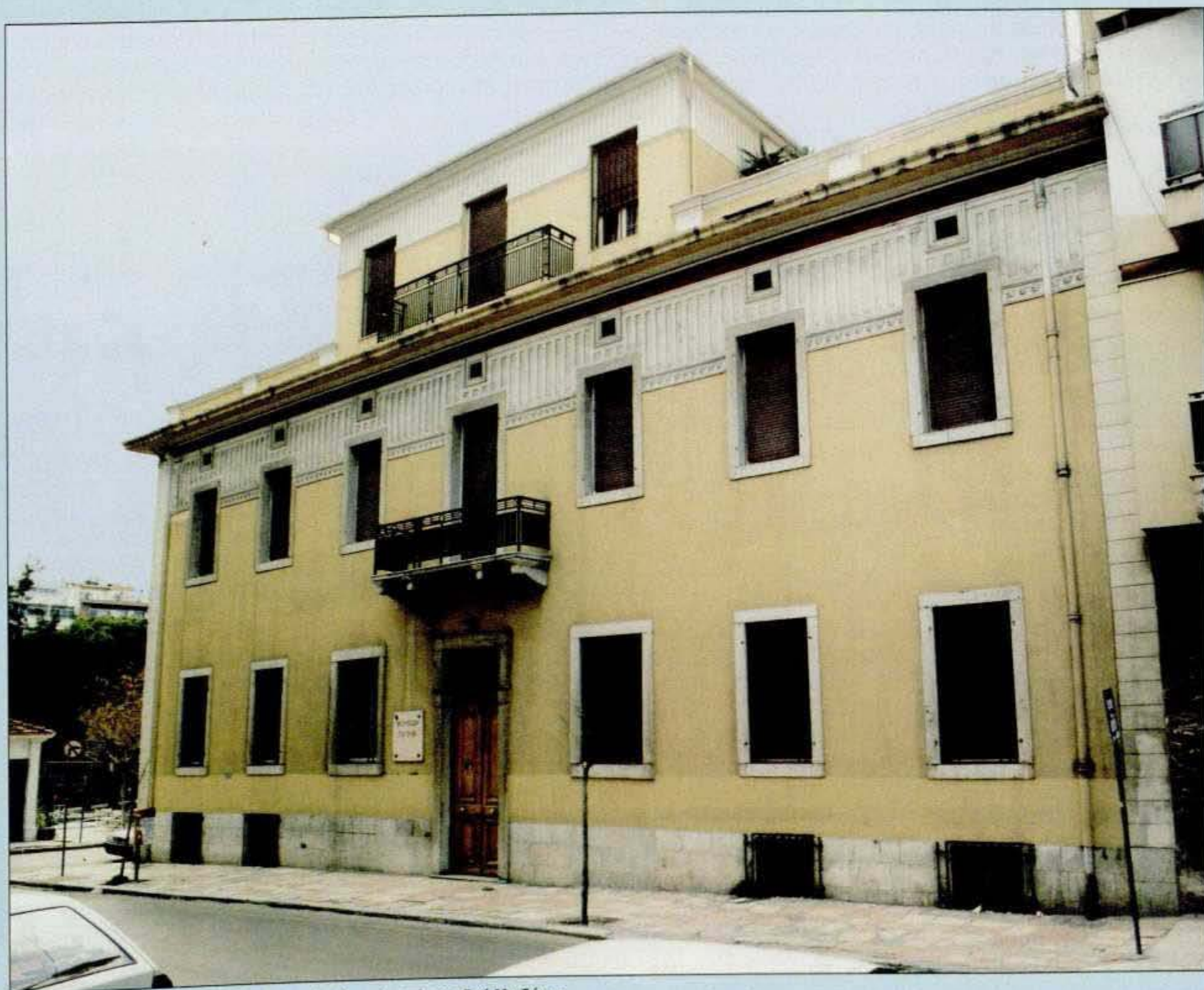
1. Η κύρια όψη του Αρχαιολογικού Μουσείου Πατρών επί της οδού Μαιζώνος.

Το 1817 ο γάλλος πρόξενος στην Πάτρα Πουκεβίλ παρατηρώντας τα ορατά ακόμη στην εποχή του αρχαία σημείωνε ότι η Πάτρα θα μπορούσε να ιδρύσει ένα ενδιαφέρον Μουσείο για τις αρχαιότητές της. Σήμερα, σχεδόν δύο αιώνες μετά τη διαπίστωση του Πουκεβίλ, και παρά το πλήθος των σωστικών ανασκαφών που έχουν γίνει, ιδίως από τη δεκαετία του 1970 και εδώ, η Πάτρα δεν έχει αξιωθεί ακόμη ενός Μουσείου αντάξιου της ιστορίας της.