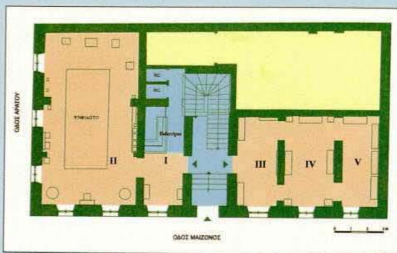
2. Κάτοψη του Αρχαιολογικού Μουσείου Πατρών.

Εν τω μεταξύ μία αποτυχημένη προσπάθεια για ένα νέο και μεγαλύτερο Μουσείο γίνεται το 1972, όταν ο Δή-