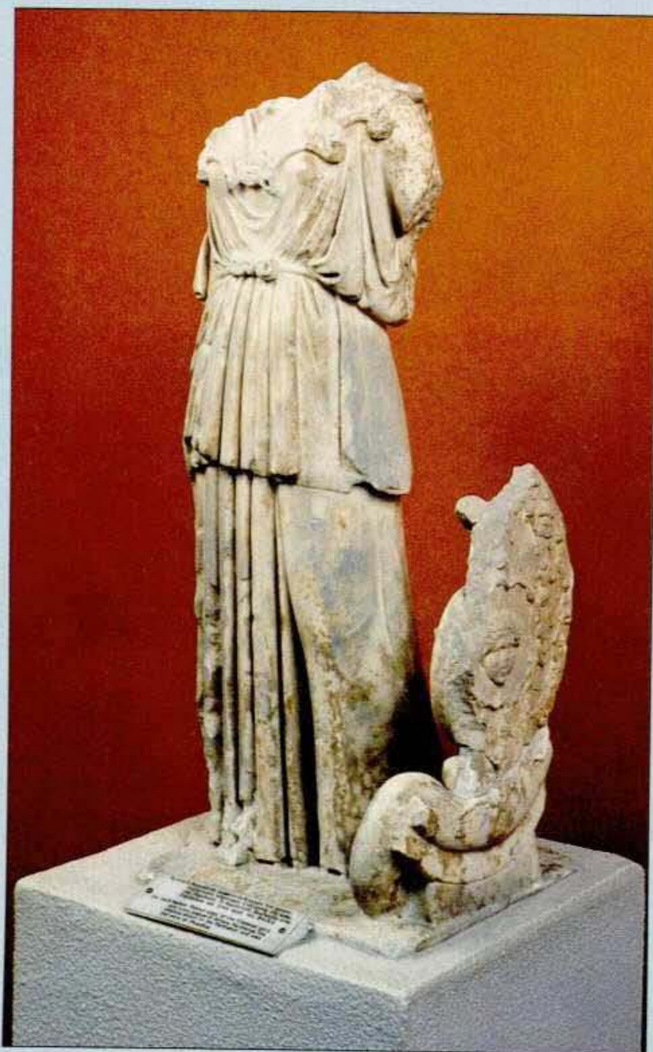
5. Ρωμαϊκό αντίγραφο της Αθηνάς Παρθένου του Φειδία.