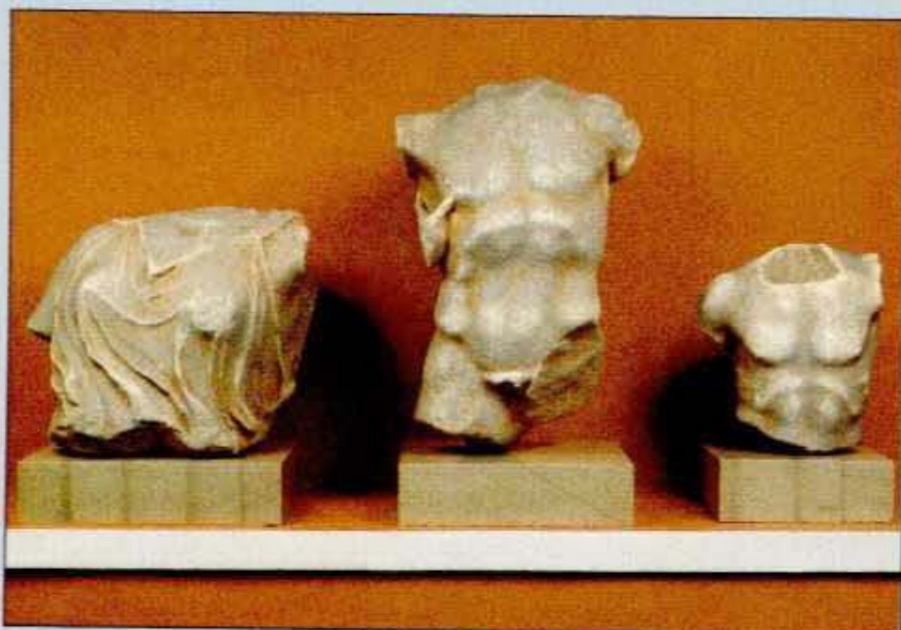
4. Τρεις κορμοί από αέτωμα ναού του τέλους του 5ου αι. π.Χ. από την περιοχή του Βελβιτσιάνικου ποταμού. Ανήκουν πιθανώς σε παράσταση Αμαζονομαχίας.

νωμένοι και κρατούν κλαδί φοίνικα. Κατά πάσα πιθανότητα το θέμα της παράστασης ο καλλιτέχνης το εμπνεύστηκε από το συνδυασμό των δρώμενων στο ρωμαϊκό στάδιο της Πάτρας, που άρχισε να έρχεται στο φως τα τελευταία χρόνια. Αντίγραφο του ψηφιδωτού εκτίθεται στο Μουσείο των Ολυμπιακών Αγώνων της Ολυμπίας.