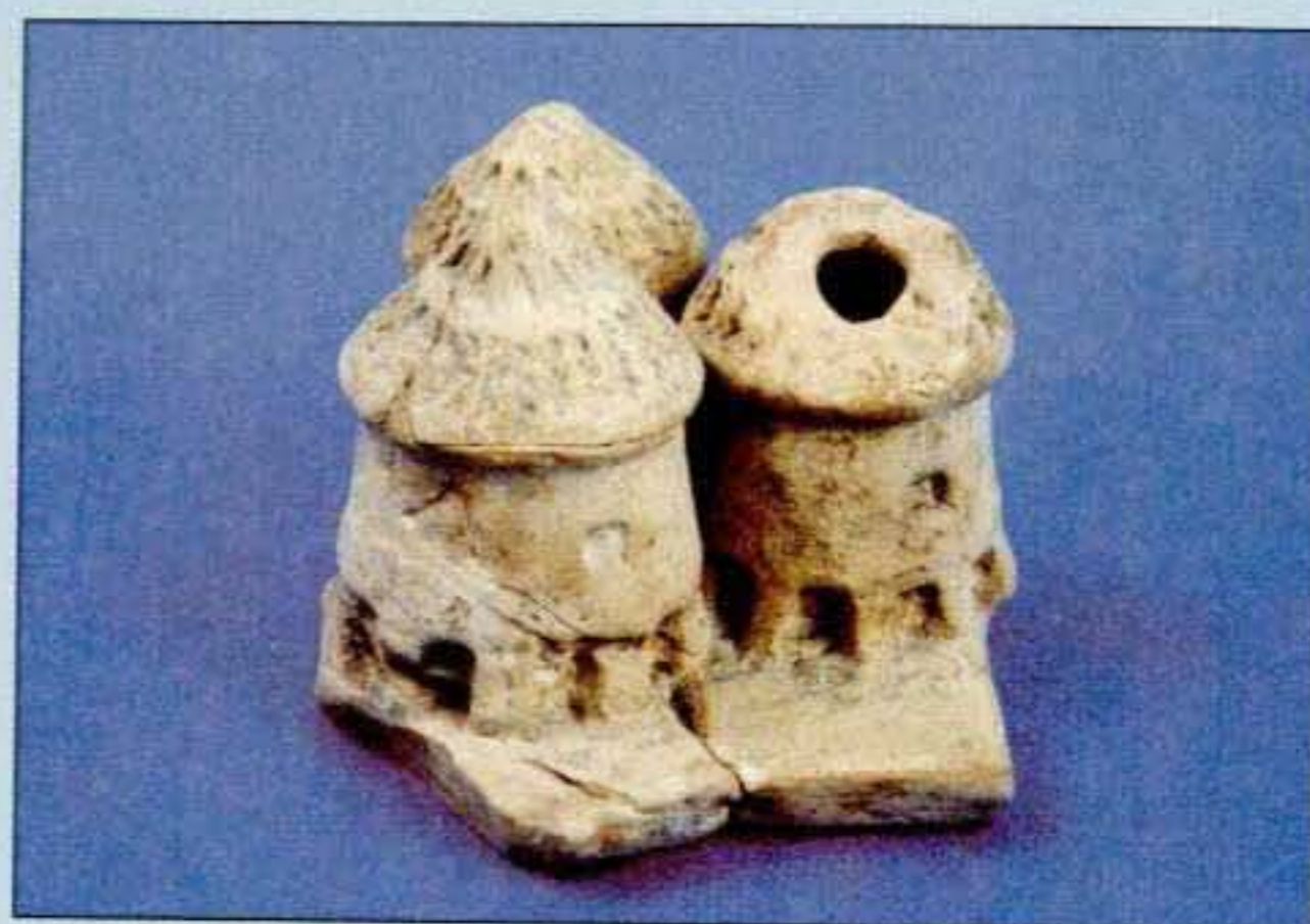
6. Τρία πήλινα ομοιώματα σιταποθηκών του τέλους του 8ου αι. π.Χ. από τον αποθέτη του ναού της Αρτέμιδος Αοντίας στον Παναχαϊκό.

νωμένοι και κρατούν κλαδί φοίνικα. Κατά πάσα πιθανότητα το θέμα της παράστασης ο καλλιτέχνης το εμπνεύστηκε από το συνδυασμό των δρώμενων στο ρωμαϊκό στάδιο της Πάτρας, που άρχισε να έρχεται στο φως τα τελευταία χρόνια. Αντίγραφο του ψηφιδωτού εκτίθεται στο Μουσείο των Ολυμπιακών Αγώνων της Ολυμπίας.