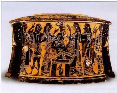
2. Η γέννηση της Αθηνάς. Πίσω από τον Δία ο Ήραιστος, κρατώντας τον πέλεκυ με τον οποίο άνοιξε το κεφάλι του πατέρα των θεών. Απτικό μελανόμορφο τριποδικό εξάλειτρο, 570-565 π.Χ. Παρίσι, Μουσείο του Λούβρου.

Κοντολογία, ολόκληρη η Τεχνολογία εκφράζεται και συγκεντρώνεται στο όνομα Δαίδαλος , τα προσωπικά έργα του οποίου κατα τον μύθο καλύπτουν πράγματι μίαν ευρύτατη ποικιλία τεχνημάτων. Ήταν δε ένας μύθος έμμονος, προγενέστερος ίσως των ομηρικών επών – μέχρι και τους ρωμαϊκούς χρόνους.