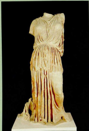
5. Το άγαλμα της Δήμητρος.