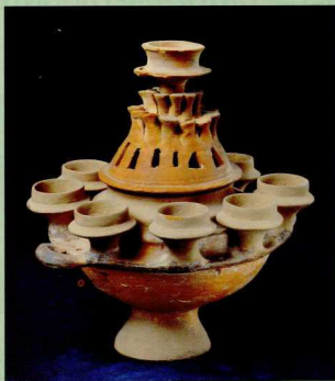
7. Πλήνους κέρνος.

Ένα ενδιαφέρον σύνολο αποτελούν επίσης τα αρχαϊστικά γλυπτά αυτής της αΐθουσας. Το πληρέστερο εικονίζει μια κόρη, που κρατούσε αρχικά στα χέρια της μια μαρμάρη λεκάνη, που δεν σώζεται σήμερα. Το νερό που περιείχε η λεκάνη χρησίμευε για τους τελετουργικούς καθαρμούς των εισερχομένων στο Ιερό της Δήμητρος.