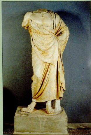
6. Το άγαλμα του Ασκληπιού.