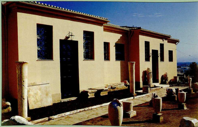
1. Πρόσψη του Αρχαιολογικού Μουσείου Ελευσίνας.

Αρχικά απαρτιζόταν από πέντε αίθουσες, παρατακτικά διατεταγμένες. Στις αρχές της δεκαετίας του 1930 προστέθηκε μια έκτη αίθουσα, στο δυτικό του άκρο. Η διάταξη του κτηρίου παραμένει έκτοτε αναλλοίωτη, όμως η έκθεση των αρχαιοτήτων τροποποιήθηκε αρκετές φορές. Η πιο πρόσφατη επέμβαση πραγματοποιήθηκε πριν από λίγα χρόνια, ύστερα από τον μεγάλο σεισμό που έπληξε την Αθήνα και κυρίως τη Δυτική Αττική, το φθινόπωρο του 1999. Το Υπουργείο Πολιτισμού προχώρησε τότε ταχύτατα όχι μόνο στην