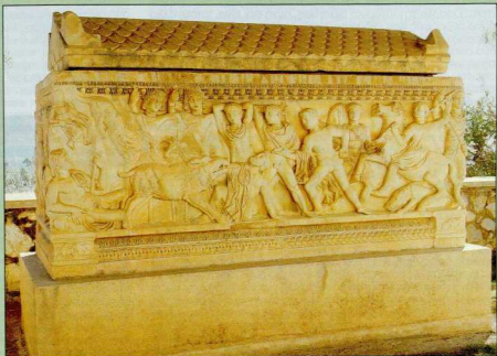
Μαρμάρηνη σαρκοφάγος με ανάγλυφη παράσταση της θήρας του Καλυδωνίου κάπρου στην κύρια όψη της, τέλος 2ου ή αρχές 3ου αι. μ.Χ.

Εξερχόμενος ο επισκέπτης από το Μουσείο στο προαύλιο του, παρατηρεί ότι εκεί είναι στημένα στο ύπαιθρο μαρμάρηνα επιτύμβια αγγεία, τμήματα αγαλμάτων, τα δυο σύνθετα κιονόκρανα των Μικρών Προπυλαίων και μια μαρμάρηνη ρωμαϊκή σαρκοφάγος με ανάγλυφη παράσταση της θήρας του Καλυδωνίου κάπρου στην κύρια όψη της. Το γεγονός καθιστά σαφή την έλλειψη επαρκούς εκθεσιακού χώρου και ερμηνεύει το ενδιαφέρον που έχει ανακινήσει προσπάθειες για την ίδρυση ενός νέου αρχαιολογικού Μουσείου, που θα πληροί όλες τις σύγχρονες προδιαγραφές και θα είναι ανάξιο της σημασίας του χώρου της Ελευσίνας.