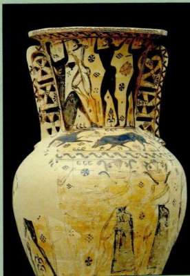
2. Ο πρωτοαττικός αμφορέας της Ελευσίνας (670-660 π.Χ.).

Η αποστολή του Τριπτόλεμου αποτελεί το κεντρικό θέμα και στο μεγάλων διαστάσεων ανάθημα του Λακρατειδίου, που εκτίθεται στο βάθος της αίθουσας. Εδώ όμως η σύνθεσή είναι πολυπρόσωπη, καθώς εκτός από τον Τριπτόλεμο