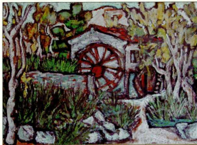
1. Νερόμυλος στο Δελφίνι, χ.χ., ακουαρέλα σε χαρτί, 63x44 εκ. Village Inn, Porto Carras.

Τα πρότυπα του Γιαλούρη μπορεί να διακρίνονται από τον αυθορμητισμό, την απλοικότητα, την ανωνυμία, τον συμβολικό και αφηγηματικό χαρακτήρα, στο έργο του όμως μεταπλάθονται με τη δικά του εκφραστική γλώσσα και γραφή. Η ελευθερία στην κίνηση, η γεωμετρικότητα, η