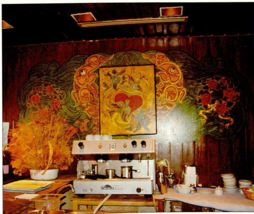
7. Φυτικά ματρία (διακόσμηση ευκλείσου) 1974, λινόλεου. Βίλα Καπετών Γιάννη Καρρά, Porto Carras.

Πέθανε τον Ιούνιο του 2003 στην «ανεμέωσα» Σ.Χίο.