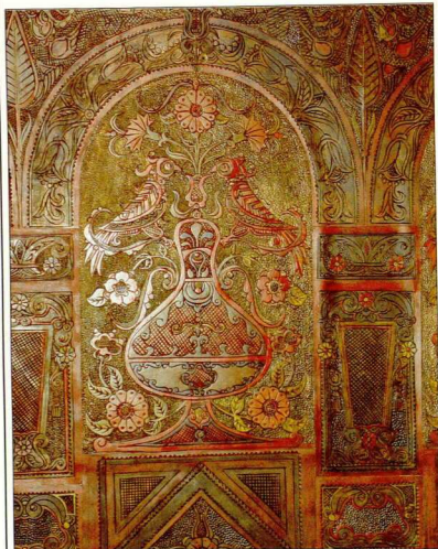
5. Δοχείο με λουκουδία και πουλιά, χ.χ., πυρογραφία. Βίκα Καπετάν Γιάννη Κορρά, Porto Carras.

Η βασιική φυτική σύνθεση που κυριαρχεί στο διακοσμητικό του έργο είναι το ανθοφόρο αγείο με τις αγαπημένες του κόκκινες λαλάδες με τον μακρύ και κομψό μίσχο, με τα τριαντάφυλλα, με τα γαρίφαλα και τους κατιφέδες – σύνθεση που απαντά σε πολλαπλές παραλλαγές με κεντρικό μοτίβο το κυπαρίσσι, το ηλιοτρόπιο, την παπαρούνα ή το σταυρό.