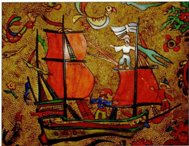
6. Σκυριανή γαλέρα (λεπτομέρεια σύνθεσης με γαλέρες και γοργόνες) 1974, λινόλεου, 1,70x1,20μ. Βίλα Καπετών Γιάννη Καρρά, Porto Carras.

Τα έργα του ήταν χαρακτηριστικά, λαδοπλαστέλ