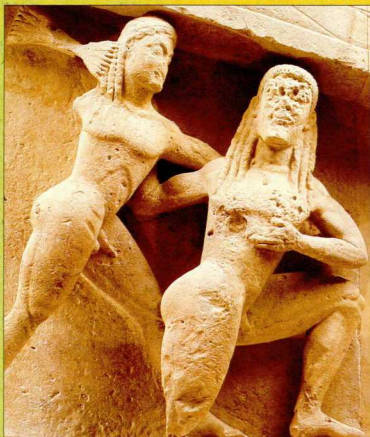
1. Σκηνή από την Τιτανομαχία. Ο Δίας, όρθιος, επιτίθεται με τον κεραυνό του εναντίον ενός Τιτάν, ίσως του Ιαπετού (ασεωματικό γλυπτό από το ναό της Αρτέμιδος στην Κέρκυρα, περ. 590 π.Χ. Κέρκυρα, Αρχαιολογικό Μουσείο).