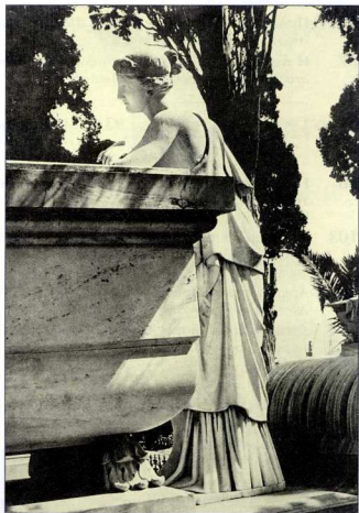
1. Γυναικεία μορφή στον τύπο των αρχαίων αγαλμάτων. Από το ταφικό μνημείο Στ. Κ. Πρωίου. Νεκροταφείο της Ερμούπολης, Σύρος.

Αλλά η αρχαιότητα, αν ανέδειξε μια πολύπλοκη σχέση μεταξύ του ελληνοισμού και των μελετητών του, δεν έπαψε, όπως προαναφέραμε, να συντελεί, εξαπτίας της ιδεολογικής της χρήσης, και σε μια αμίγως ευρωπαϊκή αντίφαση. Στην Ευρώπη, η λατρεία της αρχαίου-