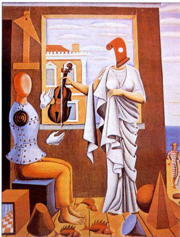
3. Ν. Εγγονόπουλος, «Ποιητής και Μούσα», λάδι σε μουσαμά, 140 x 105 εκ., 1938. Αθήνα, ιδιωτική συλλογή.

Κλείνοντας θα επιμεινουμε στο κύριο χαρακτηριστικό όλων των παραπάνω εξελίξεων. Η αρχαιολογία μεταποτίστηκε από τις έννοιες της αισθητικής και των προτύπων της αρχαιότητας, που τόσο είχε αγαπήσει ο κλασικισμός, σε μια επανεκτίμηση του συνολικού ιστορικού μνημείου, επαναφέροντας έτσι στο επίκεντρο των ερευνητικών της πεδίων και άλλες εποχές και επανεκτιμώντας με πιο στοχαστικό τρόπο την αρχαιότητα, για να επεκταίνει στη συνέχεια τα ενδιαφέροντά της τόσο σε άλλους τομείς του μνημειακού όσο και στο γενικό περιβάλλον παραγωγής και νοηματοδότησης των μνημείων.