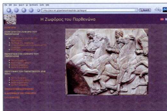
1. Η εισαγωγική οθόνη του δικτυακού τόπου για τη ζωφόρο του Παρθενώνα.

Εκδοσή στο διαδίκτυο του περιεχομένου του οπτικού δίσκου, που κυκλοφόρησε το φετινό καλοκαίρι. Περιλαμβάνει φωτογραφική τεκμηρίωση όλων των σωζόμενων λίθων της ζωφόρου, που φυλάσσονται σε τρία διαφορετικά μουσεία, της Ακρόπολης, το Βρετανικό και του Λούβρου. Την παρουσίαση της ζωφόρου ολοκληρώνουν οι σχεδιαστικές αποτυπώσεις των J. Carrey (1674) και J. Stuart (1751). Προσφέρει πλούσια εισαγωγική παρουσίαση, περιήγηση στη ζωφόρο, περιγραφή των παραστάσεων ανά λίθο, καθώς και παραρτήματα με τη μέθοδο αριθμησης των λίθων, ελληνική και ξένη βιβλιογραφία και αναφορά στους συγγραφέες του έργου (επιμέλεια περιεχομένου Α. Χωρέμη και Κ. Κατράκταλη, φωτογραφίες Σ. Μαυρομάτση, σχεδιασμός εφαρμογής Κ. Αντωνιάδης, επιμέλεια παραγωγής Ε. Σαχίνη) (εικ. 1).