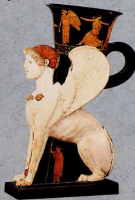
2. Η ελληνική σφίγγα είχε τη μορφή γυναίκας, με λιονταρίσιο σώμα και φτερά.

Βγάζει τα μάτια της, κοιμάται. Βάζει τα μάτια της και γίνεται μπαμπούλας. Ποια είναι; [Η Λάμια]