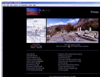
3. Metis, οθόνη παρουσίασης της Πρίνη. Στα αριστερά η κάτοψη του χώρου σε μεγέθυνση, με σημειωμένη τη θέση του ιερού της Αθήνας, και στα δεξιά η πανοραμική εικόνα του ναού της Αθήνας.

Η συλλογή αυτή περιλαμβάνει παρουσιάσεις 63 αρχαιολογικών θέσεων στην Ελλάδα και την Τουρκία από την προϊστορική μέχρι τη