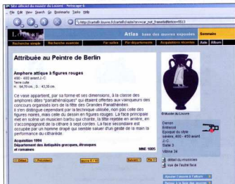
3. Κύρια οθόνη παρουσίασης ενός εκθέματος με το παράδειγμα ενός αμφόρεα, που αποδίδεται στο ζωγράφο του Βερολίνου.