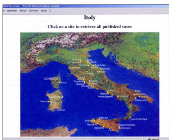
1. Γεωγραφική πρόσβαση στο περιεχόμενο της Beazley Archive Pottery Database: δυναμική χρωτογραφική απεικόνιση των θέσεων στο χάρτη της Ιταλίας.

Για τους υπολογιστές αναγνωστές υπάρχει η σύνθετη αναζήτηση στο σύνολο των πεδίων (πρόσβαση, τεχνική, σχήμα, τύπος ως προς το σχήμα, επιγραφές και τύποι επιγραφών, ζωράφοι, λέξεις-κλειδιά από το εικονογραφικό θέμα, χρονολόγηση και στοιχεία για τη συλλογή στην οποία ανήκει ή τον μελετητή του αγγείου), ενώ για τα περισσότερα πεδία παρέχονται κατάλογοι με τους όρους που χρησιμοποιούνται στην ευρετηρίαση. Στη σύνθετη αυτή μορφή α-