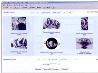
2. Ενδεικτική οθόνη με τα αποτελέσματα μιας αναζήτησης: τα δημοσιευμένα αττικά αγγεία που βρέθηκαν στο Chiusi της Ετρούριας (449 αγγεία).

ναζήτησης υπάρχει δυνατότητα προσδιορισμού κι άλλων παραμέτρων –π.χ., περιορισμός της αναζήτησης στα αγγεία που διαθέτουν εικόνα– και ακόμη επιλογή του τρόπου εμφάνισης των αποτελεσμάτων, με εικονίδια (εικ. 2) ή με μορφή συντοπικού λημμάτων ή ε-κταμαζής περιγραφής. Ακόμη, στις οελίδες του δικτυακού τόπου προσφέρονται και εκτενείς θεματικές παρουσιάσεις για την αρχαία ελληνική κεραμική. Προς το παρόν λειτουργεί η γενική επισκόπηση της αρχαίας ελληνικής κεραμικής από την πρωτογεωμετρική μέχρι τις αρχές της ελληνιστικής εποχής (περίπου 1000-300 π.Χ.) με δυναμικό χρονολογικό πίνακα, γεωγραφική απεικόνιση των κέντρων παραγωγής στην Αττική, τα σχήματα, την τεχνολογία και τη χρονολογική εξέλιξη του δακτύμου, τις τεχνικές του σχεδίου, την ανα-