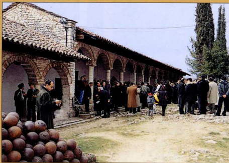
1. Γενική άποψη του Μεντρεσέ, όπου στεγάζεται η συλλογή του Φώτη Ραπακούση.

Τα εκθέματα του μουσείου κατατάσσονται σε τέσσερις βασικές κατηγορίες. Η πρώτη περιλαμβάνει όπλα αλλά και διάφορα εξαρτήματά τους: αγχέμαχα της προεπαναστατικής περιόδου (αιχμές δορμάτων, πελέκειες, σπάθες, αλεβάρδες, λογχοπελέκειες, ακόντια κ.λπ.), όπλα και αντικείμενα που χρησιμοποιήθηκαν κατά τη διάρκεια της Επανάστασης του 1821 (καριοφίλια, πιστόλες, γιγαγάνια, παλάσκες, τάσια κ.λπ.), καθώς και όπλα της περιόδου 1830-1913 (τουφέκια, περιστροφή κ.λπ.) συγκρίνησαν το συλλέκτη αποκλειστικά και μόνο λόγω της χρήσης τους σε εξεγέρσεις που ως στόχο είχαν την απόδοση δικαιοσύνης, σε εθνικούς απελευθερωτικούς και αντιστασιακούς αγώνες. Στη δεύτερη κατηγορία εκθεμάτων εντάσσονται χρηστικά αντικείμενα λαϊκής τέχνης (κανάτες, πιάτα, σινιά, γκιούμια,