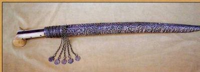
5. Ασμένιο ηπειρώτικο γιασαγάνι (1786).