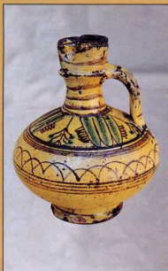
7. Κανάτι με κίτρινη υάλωση και φυτική διακόσμηση (16ος αιώνας).