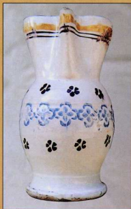
6. Τριφυλλόσχημος μαστραπάς, παλιές κατασκευές (αρχές 19ου αιώνα).