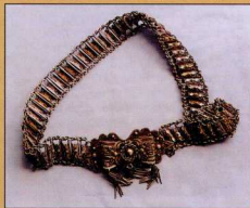
9. Ασμένια επίχρυση ηπειρώτικη ζώνη (μέσα 19ου αιώνα).