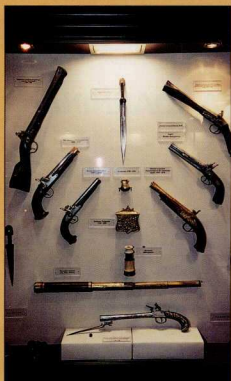
3, 4. Μέρους των αντικείμενων που εκτίθενται στο μουσείο.