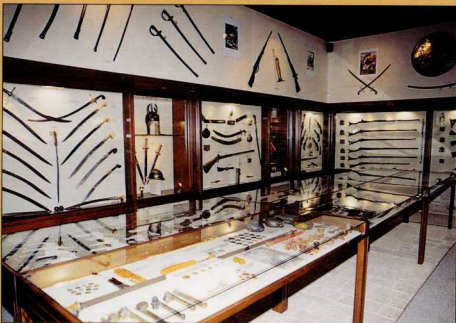
2. Γενική άποψη τμήματος του εσωτερικού του μουσείου.