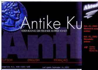
Η αρχική σελίδα του ελβετικού περιοδικού Antike Kunst .

Συνήθως οι πληροφορίες αυτές δεν πλαισιώνονται από επιπλέον στοιχεία, όπως ειδήσεις από την αρχαιολογική επικαιρότητα –συνδεδεση, εκδηλώσεις– ή άλλο περιεχόμενο ειδικά διαμορφωμένο για τη δικτυακή έκδοση, με εξαίρεση τον πρόσφατα δημιουργημένο δικτυακό τόπο του ελβετικού περιοδικού Antike Kunst . Σε ελάχιστες περιπτώσεις δημοσιεύονται στο Διαδίκτυο τμήματα από το περιεχόμενο της έντυπης έκδοσης, όπως οι περιλήψεις των άρθρων ή, ακόμη λιγότερο, επιλεγμένα άρθρα ή όλο το περιεχόμενο, είτε από τα παλαιότερα τεύχη είτε από τα πρόσφατα ( BCH , Antikunst , ABSA : περιλήψεις των άρθρων του τρέχοντος τεύχους τουλάχιστον, The Ancient History Bulletin , Göttinger Forum für Altertumswissenschaft : όλο το περιεχόμενο για όλα τα τεύχη, AJA : για τους δώδεκα τελευ-