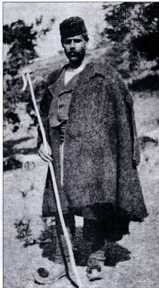
2. Βοσκός στην Πίνδο με κάπα.

Η ποιμενική κάπα στην Ελλάδα έχει διατηρήσει, από την εποχή της Τουρκοκρατίας μέχρι και σήμερα, αναλλοίωτη τη βασική της μορφή, αλλά απαντά και σε διάφορες παραλλαγές ανάλογα με τη χρηστικότητα της. Η κυριότερη μορφή κάπας στα βλάχικα χωριά είναι το ταμπάρε : μια ελεύθερη κάπα από τραγιάδαλο, τόσο χοντρή ώστε να είναι αδιάβροχη και προς τα έξω για να διώχνει τη βροχή από τα πόδια (αν και τις περισσότερες φορές δεν φτάνει μακρύτερα από τα