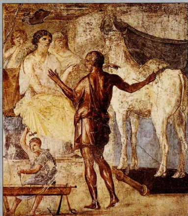
Στο εργαστήριο του Δαίδαλου, η Πασιφή θαυμάζει τη λευκή αγελάδα που έφτιαξε ο τεχνίτης για να σαγηνέψει τον Ταύρο του Ποσειδώνα.

τον ζήτησε από τον Μίνω, ο πονηρός βασιλιάς τού έδωσε έναν ταύρο όμορφο και δυνατό, αλλά όχι εκείνον τον θεϊκό. Ξεγελιέται όμως ένας θεός; Η τιμωρία του Μίνω ήταν φοβερή! Η Πασιφή αγάπησε τον ταύρο και γέννησε ένα παιδί-τέρας, άνθρωπο με ταυρίσιο κεφάλι. Ήταν ο Μινώταυρος.