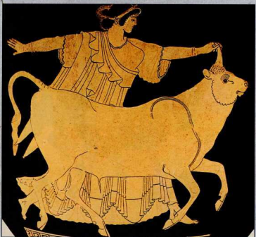
Η Ευρώπη παίζει με τον ταύρο στα λιβάδια της Φοινίκης.