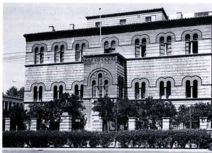
1. Το Οφθαλμιατρείο Αθηνών σήμερα.