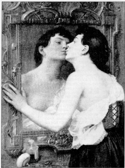
Antoine Magand, Φύλι στον καθρέφτη (1885).

ζει σαφώς μια εποχή ή χρονολογία, το όνειρο αναφέρεται σε κάποια παλιά σύγκρουση, δηλαδή σε οιδιπόδειο ή πρωτοφρηβικό ανταγωνισμό με τον πατέρα, όπως υποδηλώνει το γεγονός ότι η χρονολογία στο όνειρο συνέπιπτε με την ύστερη παιδική ηλικία του ασθενούς. Η επίγνωση που είχε ο ασθενής για τον συγκεκριμένο χρόνο είναι αυτή ενός παρατηρήτη, κάποιου που είναι συναισθηματικά αποσυνδεδεμένος από το λανθάνον περιεχόμενο του ονείρου.