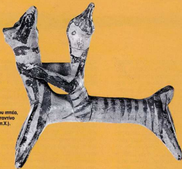
6. Ειδώλιο μυκηναίου ιππία, από τον Άγιο Κωνσταντίνο Μεθών (13ος αι. π.Χ.).

ρου, που χρονολογείται στο α' μισό του 7ου αι. π.Χ. Στην αρχαϊκή εποχή (στον 7ο και 6ο αι. π.Χ.) ανήκουν επίσης τα κεραμικά ευρήματα από το Ιερό του Ποσειδώνα στην Καλαύρεια (αρύβαλλοι και ειδώλια) και από την ανασκαφή του Legrand στο Ιερό της Δήμητρας Θεσμοφόρου στην Τροιζήνα (μικρογραφικά λυχνάρια και σκυφίδια).