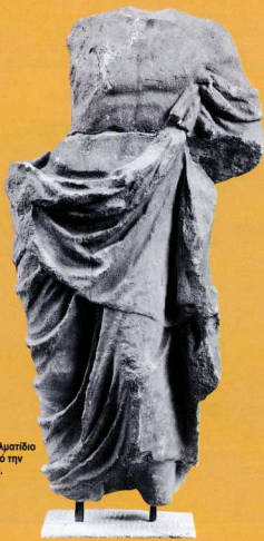
2. Μαρμάρινο αγαλματίδιο του Ασκληπιού από την Αρχαία Καλαύρεια.

Στην ίδια αίθουσα εκτίθενται και δείγματα από αρχιτεκτονικές τερρακότες, που προέρχονται από την κεράμωση των κτιρίων του Ιερού του Ποσειδώνος στην Καλαύρεια, από την Αρχαία Τροιζήνα και από τα Μέθανια. Ξεχωριστό ενδιαφέρον παρουσιάζει ένας αρχαϊκός ηγεμόνας καλυπτήρας με κερατοειδείς προεξοχές (τέλη 7ου-αρχές 6ου αι. π.Χ.), που βρέθηκε σε πρόσφατη