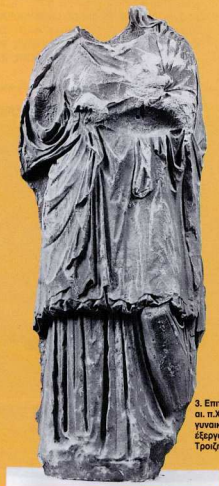
3. Επιτύμβια στήλη του 4ου αι. π.Χ. με παράσταση γυναίκας μορφής σε έξεργο ανάγλυφο, από την Τροιζήνα.