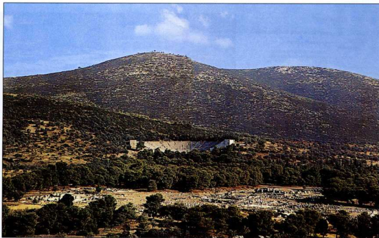
Επίδουρος, γενική όψη.

Πέρα από τις γενικές, διαχρονικές και πανανθρώπινες φιλοσοφικές και ιδεολογικές αρχές της θεραπευτικής τέχνης που προβάλλονται μέσα από το μύθο του Ασκληπιού, θα προσπαθήσουμε να αναγνωρίσουμε τα φιλοσοφικά και ιδεολογικά χαρακτηριστικά του θεραπευτικού περιβάλλοντος, το οποίο, σύμφωνα με την ερμηνεία του μύθου, βασίζεται στην αρμονική συνεργασία ανάμεσα στις θεϊκές θεραπευτικές δυνάμεις της φύσης και στην απαιτούμενη ανθρώπινη προσπάθεια.