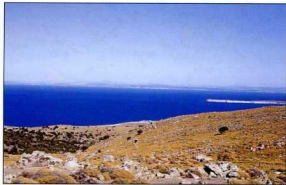
3. Τμήμα της ΒΑ παραλιακής ζώνης με τις προϊστορικές εγκαταστάσεις.