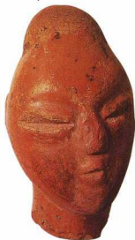
Κεφάλι γυναικείου πηλίνου ειδώλιου, Μουσείο Λάρισσας (Θεοχάρης 1981).

Μεθοδολογικά, οι επιστημονικές αυτές οριοθετούν ένα νέο πεδίο στο οποίο ο ερευνητής μπορεί να θέσει τώρα το παρατηρητήριο του, το «πλάσιο ανεύρεσης των δεδομένων» (context), που αφορά την κατανόηση της συνάφειας των αντικειμένων στο χώρο εύρεσής τους ως δηλωτικής των συμβολικών συσχετισμών τους που έγιναν κατά τη διάρκεια της κοινωνικής πράξης που έλαβε χώρα στον χώρο αυτό (Hodder 1991). Έτσι, όλα τα αντικείμενα του νεολιθικού νοικοκυριού (ειδώλια, υφαντικά βάρη, εργαλεία,