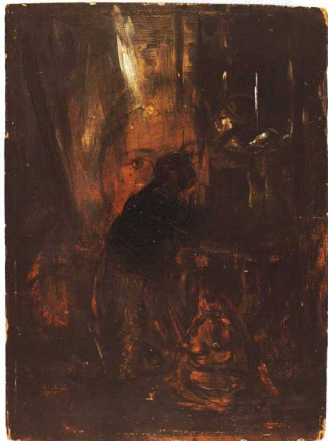
1. Λύτρας Νικηφόρος “Το όραμα”, 0,215 x 0,16 μ. Ιδιωτική συλλογή.