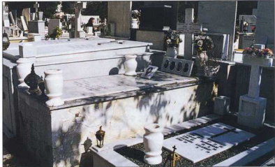
Η πυκνότητα ενός σημερινού νεκροταφείου (Δήμος Νέας Σμύρνης).

του για κάθε περίπτωση αριθμού νεκρών, θα οδηγούσε ασφαλώς συνειρμικά στο χώρο των κατακομβών της Μήλου, της Ρώμης, του Παρισιού κ.λπ., όπως επίσης και στις αρχέτυπες μορφές χώρου του Αθῆν, του "Κάτω Κόσμου", του υποχθόνιου κόσμου. Οι τάφοι των Ρωμαϊκών χρόνων στην Πέτρα είναι ένα εξαιρετό ιστορικό παράδειγμα. Η κατάλληλη αρχιτεκτονική αναζήτηση των όψεων και των πυλών αυτών των χώρων, αλλά και των εσωτερικών εγκαταστάσεων και εξοπλισμού, θα μπορούσαν να δώσουν εντυπωσιακά αποτελέσματα, τόσο αναβαθμίζοντας τη σημερινή εικόνα των εγκαταλεμμένων και πληγωμένων αυτών ορεινών τημάτων, όσο και παρουσιάζοντας την εικόνα ενός νέου χώρου νεκρών.