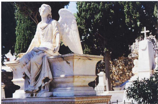
Το νεοκλασικό κοιμητήριο της Ερμούπολης με εξαιρετο δείγμα της πολύ υψηλής ταφικής τέχνης της εποχής.