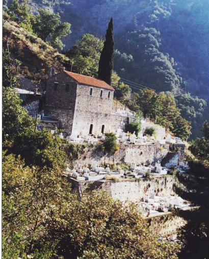
Λαγκάδια της ορεινής Γορτυνίας. Ο τόπος των νεκρών γποννάζει με αυτόν των ζωντανών.

Το κοιμητήριο είναι ένας πυκνωτής Ιστορίας και μύθου της πόλης, ένα είδος «μυθο-φυλάκιο» της. Όλη η Ιστορία της ανθρωπότητας στηρίχθηκε και άντλησε τις περισσότερες πληροφορίες της από αυτό το μυθοφυλάκιο. Μέσα από αυτή την αστείρευτη πηγή πληροφόρησης οι γενεές όλων των εποχών διηγούνται την Ιστορία της περιόδου που ζήσαν. Έτσι λοιπόν, το νεκροταφείο δεν είναι μόνο ένας χώρος του «άλλου» τόπου, αλλά και του «άλλου» καιρού ή, ακόμα καλύτερα, των «άλλων καιρών». Όλων αυτών των καιρών που αναγράφονται στις ταφόπλακες ως μαρτυρίες έλευσης και αναχώρησης του κάθε «ενθάδε κοιμημένου». Ο άλλος τόπος, ο άλλος καιρός, ο έξω, ο μακρινός από εμάς, από την κάθε σημερινή πραγματικότητα, άρα ο εξωπτικός, ο απόμακρος, αρχίζει να επιβάλλει την κυριαρχία της τεχνολογίας, τη δεσποτία της μηχανικής επί του ανθρώπου. Η φυγή στο εξωτικό στοιχείο, ο οριενταλισμός 4 , ήταν η κυριότερη έκφραση αυτής της τάσης, αφού για την Ευρώπη (Δύση) η Ανατολή ήταν ο «έξω τόπος», η φυγή στο κοσμικό ούμπαν, η φυγή στη μοναξιά ή στον τρόπο, στη φρίκη, στη βία. Φυγή... φυγή στο θάνατο, το χώρο της αιώνιας απομάκρυνσης. Το κοιμητήριο του Père Lachaise στο Παρίσι, που θεωρήθηκε το πρώτο-