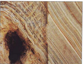
4, 5, 6. Λεπτομέρειες από τον αλάβαστρο του Τάφου.