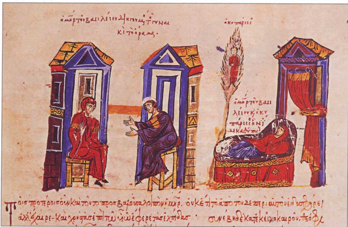
5. Το τρίτο συμβολικὸ ὄνειρο τῆς μητέρας του Βασιλείου. Ἀριστερὰ, ἡ ἀφήγησιν του ονείρου σε «θεῖα», θρησκευτικῶς διαπλεκόμενη, ἀντὶ σε ονειροκρίτη: ο Βασίλειος πᾶνω στο χρυσο κυμαρίσιο, ὄναρ αυτοκράτωρ. (Χρ. Σκυλίτζη, φ. 84, 12ος αἰ.)

Ο καθηγούμενος, δηλαδὴ, τῆς μονῆς βλέπει σε ὄνειρο τον μάρτυρα Διομήδη να τον προτρέπει να βγει στον πυλῶνα τῆς μονῆς καὶ να καλέ-