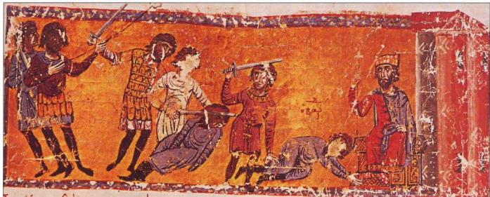
7. Για την ικανοποίηση του ηρατρείου και του Βασιλείου ο καισάρης Βάρδας διαμελίζεται και οι όρκες του στην άκρη δόρατος υψώνονται προς τους ουρανούς ως λάβαρο της νέας ελευσίας. (Χρ. Σκυλίτζη, φ.80, 12ος αι.)

ολόχρυσα κλαδιά και φύλλα, και στην κορυφή του ο ταύτης υιός Βασιλείου εκαθέζετο . Ολα χρυσά, όλα λαμπρά και πανύψηλα στο νεώπλουτο όνειρο του αγρότη και πέντητα.