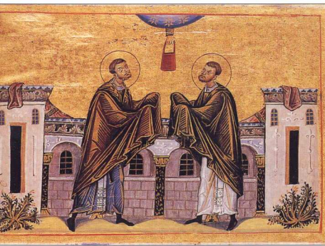
Οι άγιοι Κοσμάς και Δαμιανός παραλαμβάνουν από τους ουρανούς το ιατρικό χάρισμα με τη μορφή ιατρικής τσάντας. Μνηολόγιο του Βασιλείου Β' Βουλγαροκτόνου, αρχές 11ου αι. (Κώδικας Vaticanus gr 1613, φ. 152).