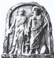
Ανάγλυφο του Ασκληπιού από τη Βέροια.

Ασκληπιείο Επιδάουρου. Διάγραμμα όπου ξεχωρίζουν: α) με πράσινο χρώμα: το τμήμα Ιατρικής περιέργειας, που αντιστοιχεί στο σύγχρονο νοσοκομείο, β) με κίτρινο χρώμα: εγκαταστάσεις που υποστηρίζουν την ολιστική φροντίδα των ασθενών. Οι αναλογίες αυτές είναι ποιοτικές και όχι ποσοτικές.