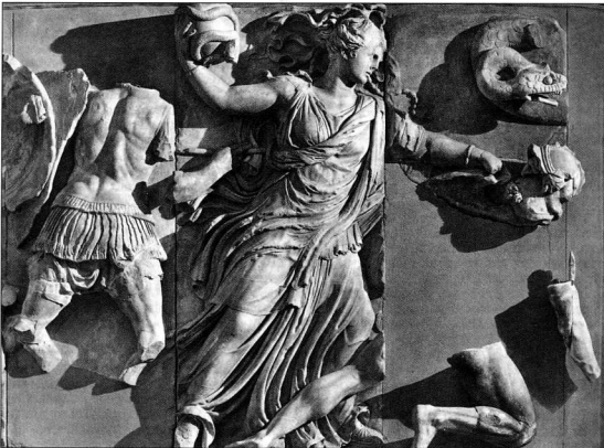
3. Νυξ. Από τα αέγματα του Μεγάλου Βιμού της Περγάμου (Μουσείο Βερολίνου).

Στα Ομηρικά Έπη διαπιστώνουμε ότι η μετάλλαξη αυτή στην αντίληψη των ονείρων έχει ήδη αρχίσει να συντελείται σε μεγάλο βαθμό. Βλέπουμε μία διάκριση στην ποιότητα των ονείρων και μία αμφισβήτηση στη θεστάτα, άρα και αξιόπιστη, προέλευσή τους. Η αναφορά στην Οδύσσεια 5 σε κατηγορίες ονείρων αυθεντικών και μη, που προέρχονται από τις δύο διαφορετικές πύλες, την κεράτινη και την ελεφαντοστέινη, μιλάει για μία σχεδόν προεπισημωμένη ψυχανάλυση των ονείρων και για μία αξιολόγηση σε κατηγορίες, βάσει των οποίων τα όνειρα δεν είναι υποχρεωτικό να αντιμετωπισθούν χωρίς κριτική διάθεση. Αξιολόγηση και κριτική συνοδεύουν την κατάταξη τους σε είδη: σε όνειρα συμβολικά και αντικειμενικά 6 . Η Πηνελόπη ονειρεύεται είκοσι χήνες που της κλέβουν τα σπατά. Ένας αετός εμφανίζεται από το βουνό και τις σκοτώνει, ύστερα ο αετός επιστρέφει και από τη στέγη του σπιτιού μιλάει στην Πηνελόπη. Στο όνειρο αυτό το σύμβολο (αετός) αντιπροσωπεύει τον Οδυσσέα, και οι νεκρές χήνες τους εξολοθρευμένους μηνητήρες. Άλλου, π.χ. Ψ 65 κ.ε.ξ., έχουμε ένα από τα όνειρα με παρουσία προσώπου, του Πάτροκλου, ο οποίος εμφανίζεται στον κοιμημένο Αχιλλέα. Εδώ έχουμε μεν μία μεταφορά του ειδώλου του νεκρού Πάτροκλου από το υπερπέραν, αλλά ο ποιητής βάζει τον Αχιλλέα να πει ότι αυτό που είδε ήταν «ψυχή και είδωλον, άταρ φρένες ούκ ἐνὶ πάμπαν» , σκιά, φάντασμα, χωρίς διάνοια. Αξιολογεί αυτό που είδε χωρίς να το δεχτεί ως πραγματικό και δεδομένο. Παρ' όλα αυτά όμως δίνει βάση σε ό,τι είδε και ακολουθεί