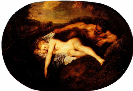
Ζεὺς και Αντίοπη, Πίνακας του ζωγράφου Βαττώ (Μουσείο Λούβρου).

Όνειρος. Γιος της Νυκτός και αδελφός του Ύπνου και του Θανάτου. Αγγελιαφόρος του Διός και όργανο του Απόλλωνα και των θεραπευτών θεών για τη μήνυση συμβουλών και θεραπειών. Αυτή είναι η γενεαλογία του Όνειρου, έτσι όπως διαμορφώθηκε κατά την κλασική εποχή. Υπάρχει ωστόσο και μία άλλη παράδοση στην αρχαία Ελληνική Γραμματεία, σύμφωνα με την οποία ο Όνειρος καταγόταν από την Θεά της γης, της Χθονός 1 . Πρόκειται για μία παράδοση η οποία μας επιτρέπει να χαρακτηρίσουμε τον Όνειρο ως σύμβολο βγαλμένο κατευθείαν από τα σπλάχνα της γης, και συνεπώς ως σύμβολο και της λατρείας της, με όσες θρησκευολογικές και σημασιολογικές ερμηνείες μπορούμε να της αποδώσουμε. Η γη και η λατρεία της έχουν να κάνουν με ένα συναισθηματικό υπόβαθρο που αγγίζει τα όρια της προαρχαϊκής υπόστασης. Ακόμα και ως λατρεία, αυτή της χθονός έχει να κάνει με μία εποχή που προηγήθηκε της κλασικής ελληνικής σκέψης, όταν οι ολύμπιοι θεοί, τα ιερά κέντρα και τα θρησκευτικά δρώμενα ήταν συνδεδεμένα με