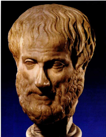
Αριστοτέλης (Μουσείο Ιστορίας της Τέχνης, Βιέννη).

προκαλώντας την ήττα των Αχαιών 3 . Στην Οδύσεια , το όνειρο της Πηνελόπτης, κατά το οποίο ένας αετός κατέβηκε και σκότωσε τις είκοσι χήνες που συντηρούσε, αποδεικνύεται, τελικώς, αληθινό. Ωστόσο, παρά τον προφανή κι ευερισμύεντο συμβολισμό του, η Πηνελόπη δεν δείχνει την ανάλογη ευπιστία, υποστηρίζοντας ότι τα όνειρα δεν επαληθεύονται πάντοτε. Διατυπώνει παραστατικά την αντίληψη ότι τα όνειρα περνούν από δύο πύλες: την κεράτινη (διαφανή) της αλήθειας και την ελεφάντινη (αδιαφανή) της πλάνης 4 .