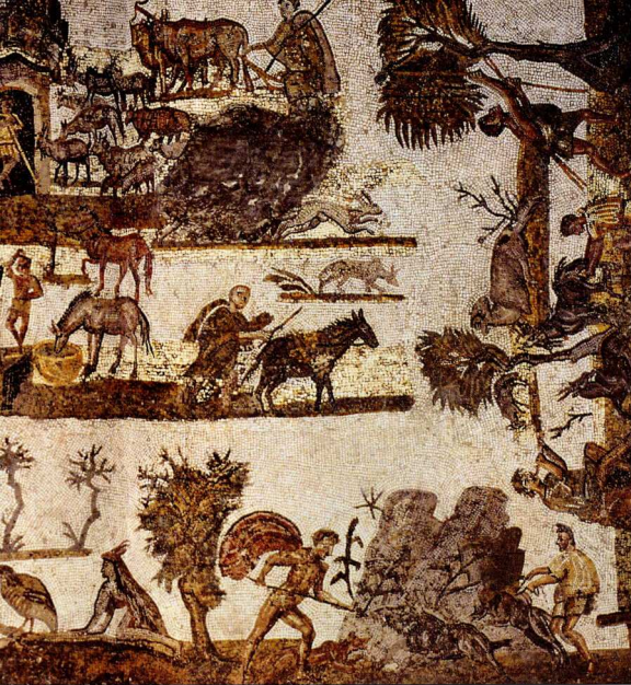
Σκηνή αγροτικού βίου. Ψηφιδωτό από την Τυνησία (Μουσείο Bardο). Ο Αρτεμίδωρος απεικονίζεται στον άνδρα μιας ταπεινής επαρχιακής πόλης, που είχε οικογένεια, οπτικό και κάποια περιουσία.

Αφού πληροφορηθεί όλα αυτά, περνάει στην ερμηνεία και την πρόγνωση. Το σύστημα των ερμηνειών υποκαίει απολύτως στη διπολική λογική, τον ακρογωνιαίο λίθο της αρχαίας ονειροκριτικής. Ένα αλληγορικό όνειρο δεν μπορεί να σημαίνει παρά κάτι καλό ή κάτι κακό. Οι ενδιάμεσες κατηγορίες αποκλείονται. Γι' αυτό και δεν θα βρει κανείς στα Ονειροκριτικά περιγραφές πολύπλοκων ψυχολογικών καταστάσεων, που θα ήταν δύσκολο να υποταχθούν στη διπολική λογική. Αυτή θα ήταν άλλωστε και η κοινώς αποδεκτή σύμβαση που πρέπει να καθόριζε και την πελατειακή σχέση.