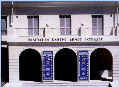
1. Είσοδος Αρχαιολογικού Μουσείου Λευκάδας.

Το Αρχαιολογικό Μουσείο Λευκάδας, χάρη στην ευγενική προσφορά του Δήμου Λευκαδίων, στεγάζεται στο νεόδμητο οικοδόμημα του Πολιτιστικού Κέντρου του Δήμου. Τα ευρήματα που παρουσιάζονται στις αίθουσες του Μουσείου καλύπτουν μια μεγάλη χρονολογική περίοδο από την Παλαιολιθική εποχή έως τους ύστερους ρωμαϊκούς χρόνους.