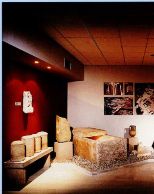
6. Αίθουσα Γ, σφαιρωμένη στα ταφικά έθιμα της αρχαίας Λευκάδας.