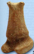
9. Πήλινο ειδώλιο Νεότερης Νεολιθικής εποχής (αίθουσα Δ).

Η αίθουσα αυτή είναι αφιερωμένη στα ταφικά έθιμα της αρχαίας Λευκάδας. Εκτίθενται επιλεκτικά επιτύμβιες στήλες, λίθινες τεφροδόχοι,