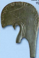
5. Χάλκινο Λαφίο μικρογραφικού κράνους με εγχάρκτη σφαιρωματική επιγραφή, 6ος αι. π.Χ. (αίθουσα Β).

η Λευκάδα βρίσκεται σε ακμή και συμμετέχει ενεργά στους Πελοποννησιακούς πολέμους και στον εμφύλιο Πελοποννησιακό πόλεμο στο πλευρό της μητρόπολης Κορίνθου. Μετά τη μάχη της Χαιρώνειας, το 338 π.Χ., η Λευκάδα καταλαμβάνεται από τον βασιλιά της Μακεδονίας Φίλιππο Β' και παραχωρείται στην Ηπειρωτική Συμμαχία. Μετά τον θάνατο του βασιλιά της Ηπείρου Πύρρου (272 π.Χ.), η Λευκάδα γίνεται ανεξάρτητη, και μαζί με άλλες πόλεις της Ακαρνανίας προσχωρεί στην Ακαρνανική Ομοσπονδία (το Κοινό των Ακαρνανών), της οποίας γίνεται και πρωτεύουσα. Το 197 π.Χ. η Λευκάδα καταλαμβάνεται από τους Ρωμαίους, και από το 196 π.Χ. καθίσταται και πόλις, με την έγκριση της Ρώμης, μέλος του Κοινού των Ακαρνανών. Μετά την ήττα του τελευταίου βασιλιά της Μακεδονίας Περγάτα το 168 π.Χ. στην Πύδνα της Περίας, η Λευκάδα αποσπάται από την Ακαρνανική Ομοσπονδία και διατηρεί μια σκιδώδη πολιτική αυτοτέλεια. Με την ίδρυση της Νικόπολης ένα μεγάλο μέρος των κατοίκων αναγκάζονται να εγκατασταθούν ως έποικοι στην πόλη αυτή. Τα ελάχιστα αρχαιολογικά δεδομένα μαρτυρούν τη συνέχιση της ανθρώπινης παρουσίας στο νησί κατά τους αυτοκρατορικούς χρόνους έως και τον 3ο αι. μ.Χ. Έκτοτε η Λευκάδα αρχίζει να παρακμάζει και οι φιλολογικές μαρτυρίες σιωπούν έως και τον 9ο αι. μ.Χ.