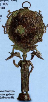
4. Χάλκινο κάτοπτρο πρώιμων κλασικών χρόνων (αίθουσα Β).