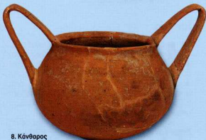
8. Κάνθαρος Μεσοελλαδικής εποχής (αίθουσα Δ).

Τοπογραφία της αρχαίας πόλης, Ιδιωτικές Κατοικίες, Άρτος, Ελιά-Λάδι, Οίνος, Εμπόριο, Νομισματοκοπία, Αλιεία, Υφαντική, Μουσική. Στην ενότητα της μουσικής ενδιαφέρον παρουσιάζουν τα χάλκινα κλειδιά αυλών που βρέθηκαν ως κτερίσματα σε αρχαίους τάφους. Στην ίδια προθήκη παρουσιάζεται ένα γελώνιο και οστέινα κλειδιά αρχαίας λύρας, μαζί με αναπαράσταση λύρας (έργο του καλλιτέχνη Γ. Πολύζου) (εικ. 2 και 3).