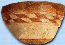
10. Αγγείο με γραπτή διακόσμηση Νεότερης Νεολιθικής εποχής (αίθουσα Δ).