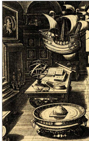
Χαλκογραφία του Theodor Galle, 17ος αιώνας: Ο λόγιος συγκρίνει τις εμπειρικές πληροφορίες της ναυσιπλοΐας με εκκίνηση που περιέχονται σε αρχαία κείμενα.

Η "κλασική" Γεωγραφία, δηλαδή η Γεωγραφία του Μεσοπολέμου, η οποία αντιστάθηκε στη γερμανική γεωπολιτική σχολή, ονομάστηκε και "περιφερειακή" Γεωγραφία. Η προσπάθειά της ήταν να αναλύσει τα διάφορα φαινόμενα σε ένα περιορισμένο πλαίσιο: την περιφέρεια. Με τον τρόπο αυτό ήλπιζε να περιορίσει το εύρος των μελετών της για να προχωρήσει σε βάθος. Ο χωρισμός του γεωγραφικού χώρου σε περιφέρειες (περιφερειοποίηση), που αποτελεί προϋπόθεση για τις περιφερειακές μελέτες, έχει