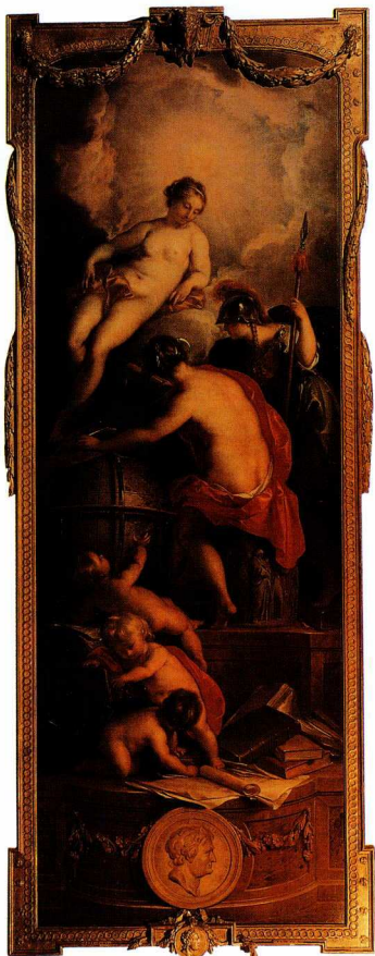
Jacob de Wit, Ιδέα σε μουσείο , 1754, Amsterdam, Historisch Museum: Στην αλληγορία αυτή η Ιστορία, στηριζόμενη πάνω στην υδρόγειο, καταγράφει τα γεγονότα σε σχέση με τον χώρο και τον χρόνο. Η σχεδόν γυμνή Αλθέα (επίσημο αρσενικό) και η Σοφία (ντυμένη ως Αθηνά) τη βοηθούν να καταγράφει τις Αναμνήσεις της.

Η τάση της ελληνικής ιστοριογραφίας να αγνοεί το χώρο δεν είναι τυχαία. Πηγάζει από τις γεωπολιτικές συνθήκες του 19ου αιώνα, όταν τέθηκαν τα θεμέλιά της. Την εποχή εκείνη, για τη θριαμβεύουσα Δύση, το Ελληνικό Βασίλειο αποτελούσε την αιχμή του δόρατος στην Ανατολή. Οι ελπίδες του για εδαφική επέκταση έμοιαζαν απεριόριστες. Η Μεγάλη Ιδέα τεκμηριωνόταν στην ιστορική συνέχεια του Ελληνισμού, επιχείρημα τότε αρκετά ισχυρό ώστε να ξεπεραστούν τα εμπόδια που δημιουργούσε η γεωγραφική ασυνέχεια του Ελληνισμού στα Βαλκάνια, στη Μικρά Ασία και στον Πόντο. Αφού λοιπόν η ελληνική εθνική ιδεολογία και η επιχειρηματολογία της Ελλάδας προς τις Δυνάμεις στηριζόταν στην Ιστορία και στο χρόνο, η Γεωγραφία και ο χώρος έπρεπε να περιοριστούν στο ελάχιστο. Έτσι εξηγείται η ταχεία παρακμή της Ελληνικής Γεωγραφικής Σχολής από τα τέλη του 19ου αιώνα και η ελαχιστοποίηση των γεωγραφικών (ή χωρικών) διαστάσεων στην εθνική ιστοριογραφία.