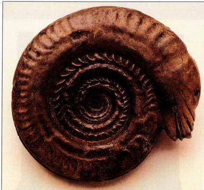
Λαξευμένο απολίθωμα αμμωνίτη, με τη μορφή φιδιού, 185.000.000 π.Χ., York, The Yorkshire Museum.

Έτσι εξηγείται, επίσης, σε μεγάλο βαθμό, η ανάπτυξη της Λαογραφίας στην Ελλάδα από τα τέλη του 19ου αιώνα, ως ανώδυνο υποκατάστατο της Γεωγραφίας. Η Λαογραφία ανέλυε την ποικιλία των ηθών και εθίμων στους διάφορους τόπους: θα μπορούσε λοιπόν να λειτουργήσει ως Πολιτισμική Γεωγραφία. Μετασχημάτιζε, όμως, τα αντικείμενά της σε εκδηλώσεις της ιστορικής συνέχειας του Ελληνισμού, καθώς αναζητούσε αναλογίες με τον αρχαιοελληνικό ή τον βυζαντινό κόσμο. Με τον τρόπο αυτό μετέτρεψε το χώρο σε χρόνο, τιθασεύοντας τη γεωγραφική πολυμορφία του βαλκανικού πεδίου. Η πολλαπλότητα των βαλκανικών πολιτισμικών μορφών αναγόταν σε μια κοινή ελληνική ρίζα, ενώ όσα στοιχεία αντιστεκόταν στην αναγωγή αυτή χαρακτηρίζονταν ξενόφερτα (και επομένως προς απόλειψη). Έτσι προετοιμάστηκε και νομιμοποιήθηκε προκαταβολικά η ελληνοποίηση, σύμφωνα με το πρότυπο του homo hellenicus , το οποίο δημιουργήθηκε στην Αθήνα από τα μεγάλα πνευματικά ιδρύματα, όπως το Πανεπιστήμιο ή η Ακαδημία.