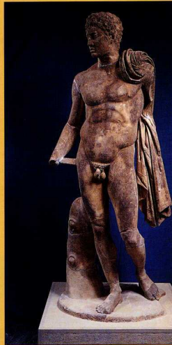
3. Άγαλμα Ερμή, στον τύπο του Ερμή της Ανδρού.

Τ ο Αρχαιολογικό Μουσείο (εικ. 1) στεγάζει ευρήματα των ανασκαφών της Αρχαιολογικής Εταιρείας στην αρχαία Μεσσήνη, οι οποίες είχαν αρχίσει το 1895 από τον Θεμιστοκλή Σοφούλη και συνεχίστηκαν από τον Γεώργιο Οικονόμο (1905 και 1926), τον Αναστάσιο Ορλάνδο (1957-1975) και τον Πέτρο Θέμελη (1986 έως σήμερα). Το Μουσείο κτίστηκε μεταξύ των ετών 1968 και 1972 στις δυτικές παρυφές του χωριού Μαυρομάτι, σε οικόπεδο που δώρισε στην Αρχαιολογική Εταιρεία ο ομογενής Δ. Λατζούνης. Τα αρχιτεκτονικά σχέδια εκπονήθηκαν από τον αρχιτέκτονα Μ. Κουρουνηώτη, σύμφωνα με τις οδηγίες του Αναστάσιου Ορλάνδου. Το Μουσείο είναι μικρό, διώροφο και απλό στη μορφή του. Στον όροφο περιλαμβάνει τρεις αίθουσες έκθεσης και εξώστη, ενώ στο ισόγειο βρίσκονται οι αποθηκευτικοί χώροι. Αρχιτεκτονικά μέλη και ενπιγράφα βάθρα έχουν εκτεθεί στο αίθριο του Μουσείου και στα υπόστεγα. Μεταξύ των ετών 1992-1999 έλαβαν χώρα εκτεταμένες εργασίες επισκευών και ανακαίνισης.