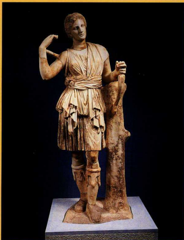
4. Άγαλμα Αρτέμιδος στον τύπο της Λαοκείας.

ροφορίες για τα οικοδομήματα από τα οποία προέρχονται τα ευρήματα.