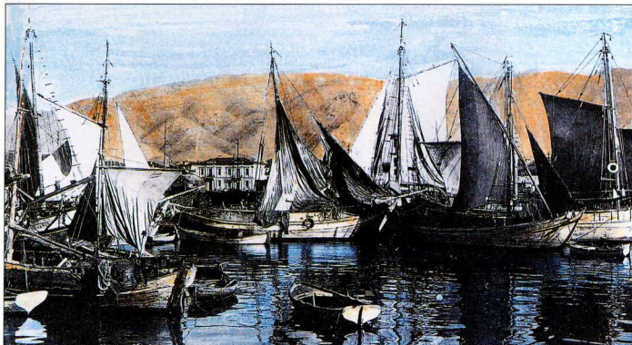
Καΐκια στο λιμάνι του Βόλου. Φωτογραφία του 1940.