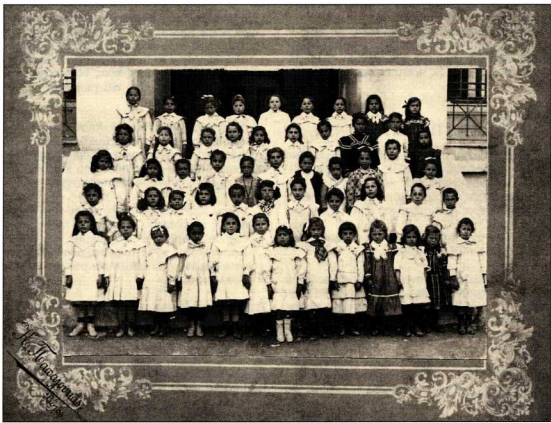
Σχολική «τάξη» σε μια παλιά, ανατυπωμένη φωτογραφία.

Η χρήση της λέξης "ντοκουμέντο" από το δή-